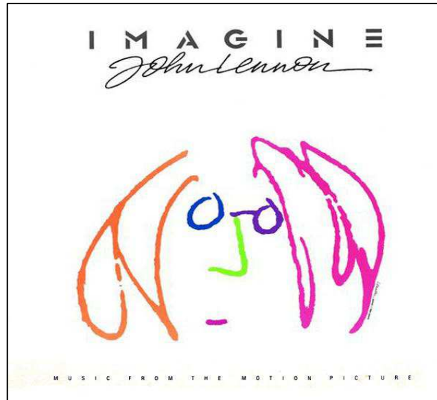
Figura 2: Capa do álbum Imagine (1971).