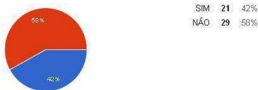
Gráfico 3: resultado das respostas dadas pelos professores na questão 7.

Atualmente existem vários recursos que auxiliam os professores em sala de aula regular ou especial, no desenvolvimento cognitivo e motor dos alunos com deficiência ou não. Sendo assim na sétima questão fizemos a seguinte pergunta: você conhece alguma tecnologia que possa lhe ajudar a trabalhar com os alunos deficientes? Sim ( ) Não ( )