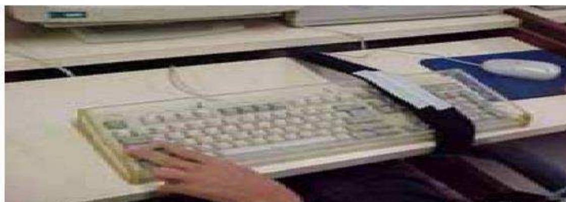
Figura 3: Máscara de teclado ou colméia.

Fonte: Damasceno e Galvão Filho (2002, p.6).