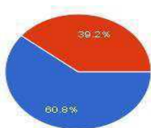
Gráfico 1: resultado das respostas dadas pelos professores na questão 1.

Atualmente a demanda de alunos com deficiência vem aumentando nas escolas de ensino regular, sendo assim a pergunta da primeira questão é: Você já trabalhou com algum aluno deficiente? ( ) sim ( ) não. O gráfico1 mostra o resultado das respostas dadas pelos professores.