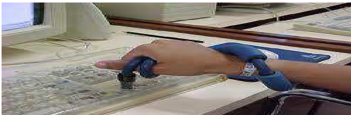
Figura 2: Estabilizador de punho e abductor de polegar

Fonte: Damasceno e Galvão Filho (2002, p.5)