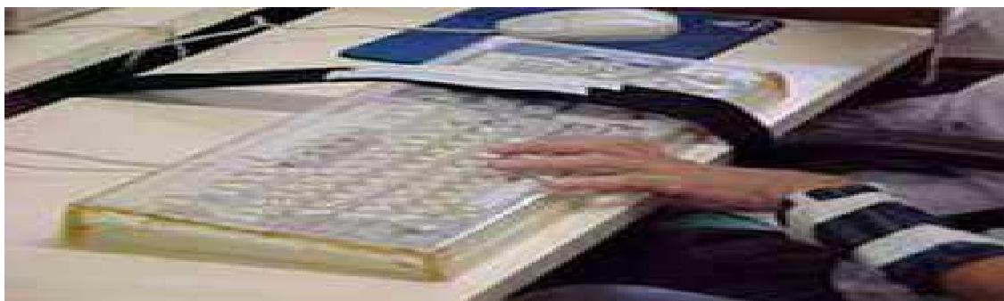
Figura 1: Pulseira de pesos