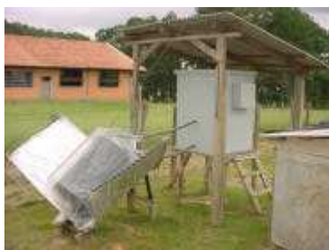
Figura 1. Vista geral do sistema biodigestor acoplado ao coletor solar.

Para carregar o biodigestor com volume útil de 80 L de afluente, utilizou-se esterco fresco de suíno adulto em fase de terminação. Na primeira fase de medidas utilizou-se o coletor solar para manter a água aquecida. O sistema termossifão permitiu que a água quente circulasse pelo sistema, mantendo a homogeneidade da temperatura, que variou de 24 a 35°C durante períodos de 24 horas. O carregamento foi feito no dia 22 de Março de 2006, e o gasômetro foi zerado. A medida do volume de biogás produzido foi diária, sendo realizada também a medida da temperatura do ar e, posteriormente, era efetuada a correção no volume de biogás para 1 atm e 20°C, de acordo com metodologia empregada por CAETANO (1985) e HARDOIM (1999). As medidas foram coletadas num período de 15 dias (22/03 a 06/04), para efeito de comparação com o aquecimento realizado pelo sistema elétrico. Na segunda fase de medidas de produção de biogás utilizou-se um sistema elétrico para aquecimento da água. O carregamento com os dejetos foi feito no dia 10 de Abril de 2006, e o termostato foi ajustado para acionar o sistema de aquecimento da água para temperaturas menores que 35°C. As medidas de produção de biogás foram coletadas num período de 15 dias (10/04 a 25/04).