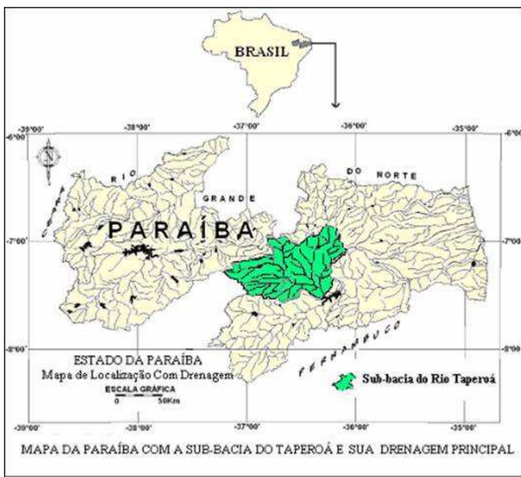
Figura 1 Localização da sub-bacia do Rio Taperoá, no Estado da Paraíba

A vegetação natural dominante na área da sub-bacia do Rio Taperoá é de caatingas hiperxerófila, hipoxerófila, floresta caducifólia e subcaducifólia. Em alguns trechos a caatinga se apresenta densa, com vegetação rasteira constituída por herbáceos espinhosos e arbustos densos com significativa concentração de cactáceas (SEMARHM, 2000). As áreas desmatadas e utilizadas para agriculturas são em geral, ocupadas pelas culturas de palma forrageira, agave, algodão, milho e feijão; os solos são do tipo: Bruno Não Cálcico de pouca espessura, que cobre todo o cristalino existente na área de limite da sub-bacia, Litólicos, Solonetz Solodizado, Regossolos e Cambissolos (AESAs, 2006).