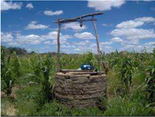
Figura 8. Poço amazonas localizado no município de São José dos Cordeiros