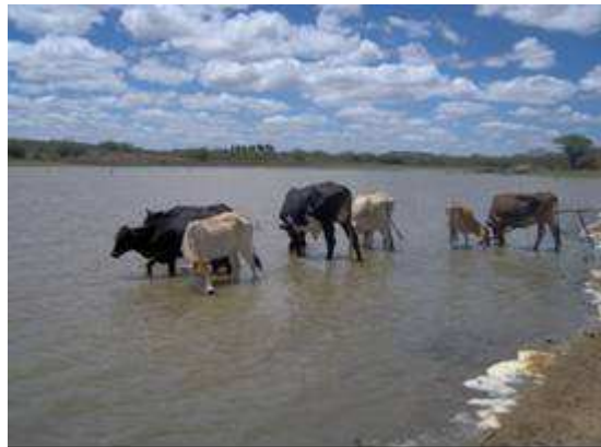
Figura 11. Fonte usada para consumo animal em São José dos Cordeiros