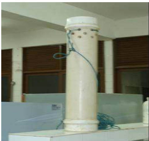
Figura 13. Coletor de água desenvolvido para esta pesquisa, com extensão para o projeto MAQUASU- FUNASA/UFCG

As amostras de água foram coletadas com um equipamento previamente desenvolvido pelo autor, confeccionado em tubo de PVC rígido branco PN 20, com diâmetro de 100 e comprimento de 600 mm, usando-se cap's para vedação, perfurado com brocas de 10 mm em uma das extremidades, em 3 camadas, com um orifício de 20mm inferior (Figura 13), para proceder à descarga de água em funil (Figura 14). Os pontos de coleta foram georreferenciados usando-se um GPS 12 XL (Figura 15), e fotografados com máquina digital HP. As águas foram acondicionadas em garrafas PET, previamente lavadas e enxaguadas no momento da coleta, as quais foram totalmente cheias, vedadas e etiquetadas com número de identificação, nome do município e tipo de fonte à que pertenciam; em seguida, foram encaminhadas ao o Laboratório de Irrigação e Salinidade da UFCG (LIS) (Figura 16), no qual foram caracterizadas físico quimicamente, determinando-se a condutividade elétrica, pH, Cálcio, Magnésio, Sódio; Potássio, Carbonato, Bicarbonato, Cloreto e Sulfato. Calculou-se a RAS a partir dos resultados obtidos de Cálcio, Magnésio e Sódio.