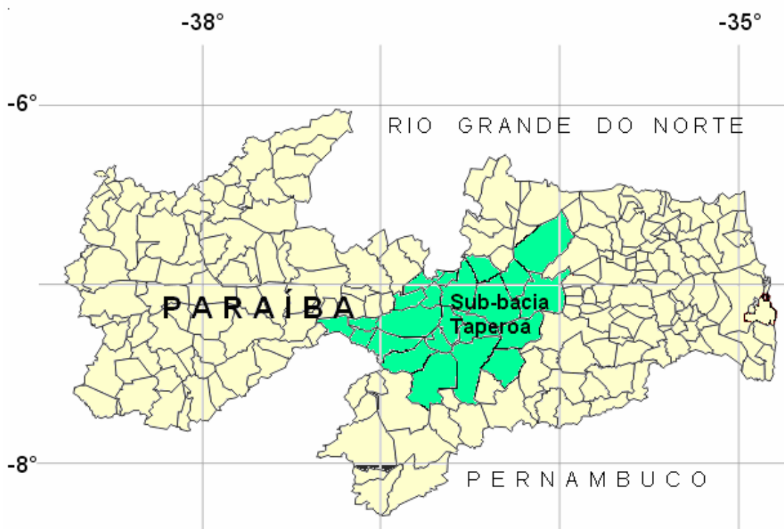
Figura 2 Mapa da Paraíba com delimitação espacial e política, destacando-se os municípios com drenagem total ou parcial para a sub-bacia do Rio Taperoá