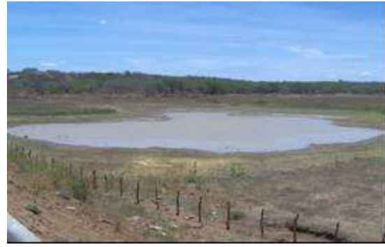
Figura 5. Açude localizado no município de Boa Vista