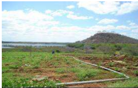
Figura 12. Fonte utilizada para pequena irrigação, no município de Cabaceiras