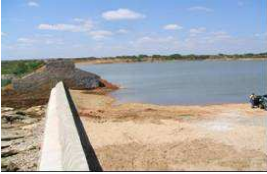
Figura 4. Barragem localizada no município de Gurjão