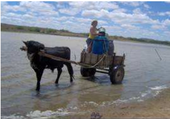
Figura 10. Fonte para consumo humano e animal, em São J. dos Cordeiros