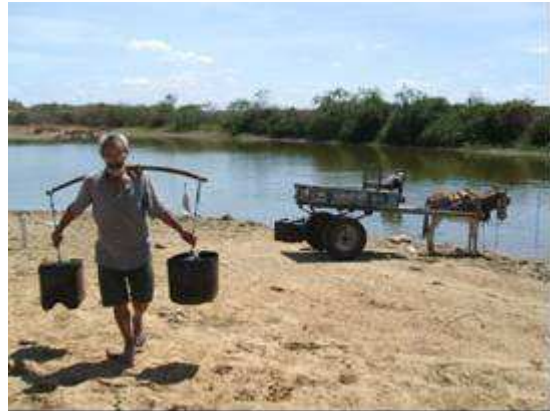
Figura 9. Fonte utilizada para consumo humano no município de Boa Vista