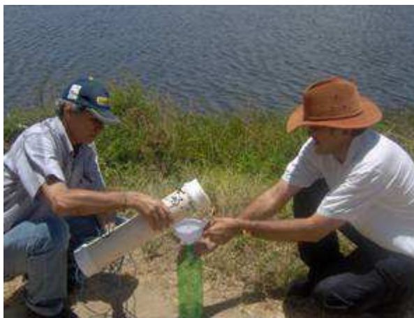
Figura 14. Procedimento do envasamento das amostras de água em garrafas PET a serem conduzidas para análises no laboratório de Irrigação e Salinidade da UFCG (LIS)