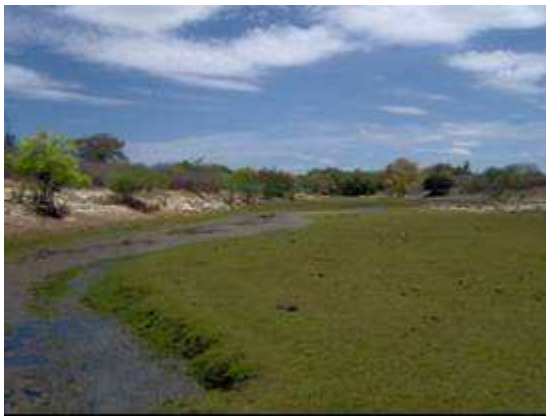
Figura 6. Água corrente (Rio Salgado) localizada em de São João do Cariri