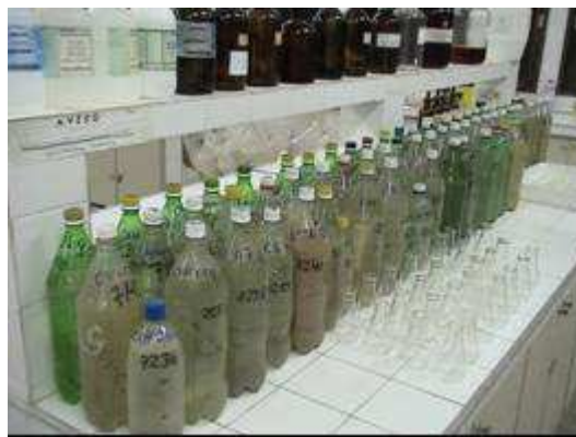
Figura 15. Ficha de campo, GPS e Condutivímetro, usados na pesquisa Figura 16. Amostras de água para análises na bancada do laboratório da UFCG

A condutividade elétrica é a capacidade que a água possui de conduzir corrente elétrica, parâmetro este relacionado à presença de íons dissolvidos na água, que são partículas carregadas eletricamente. Quanto maior à quantidade de íons dissolvidos maior também será a condutividade elétrica da água. Em águas continentais, os íons diretamente responsáveis pelos valores da condutividade são, dentre outros, o cálcio, o magnésio, o potássio, o sódio, carbonatos, carbonetos, sulfatos e cloretos.