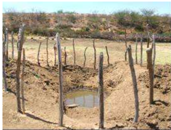
Figura 7. Cacimba localizada no município de Boa Vista

Poços amazonas, que são escavações com mais de um metro de diâmetro, construídos com revestimento de tijolo ou anéis de concreto com profundidades na ordem de 10 a 20 metros (Figura 8). Dentre as amostras de água, 130 foram coletadas em açudes, 45 em poços amazonas, 9 em fontes de água corrente, 3 em barragens e 12 em cacimbas; em geral, essas águas são utilizadas para consumo humano (Figura 9), consumo humano e animal (Figura 10), consumo animal (Figura 11) e, em alguns casos, para pequena irrigação (Figura 12).