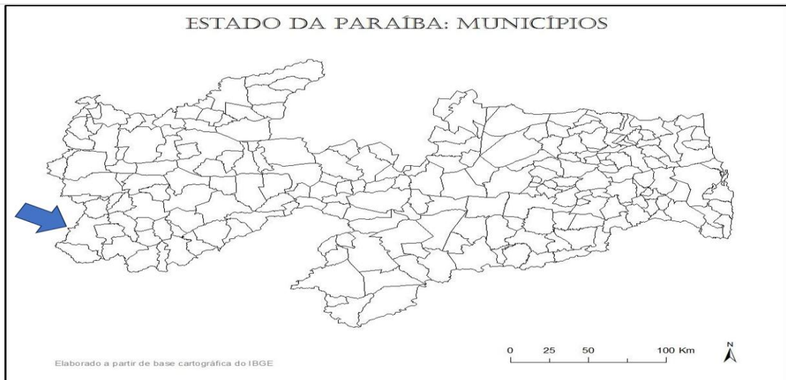
Imagem 1 - “Imagem da localização do município de conceição – PB no mapa da Paraíba”.