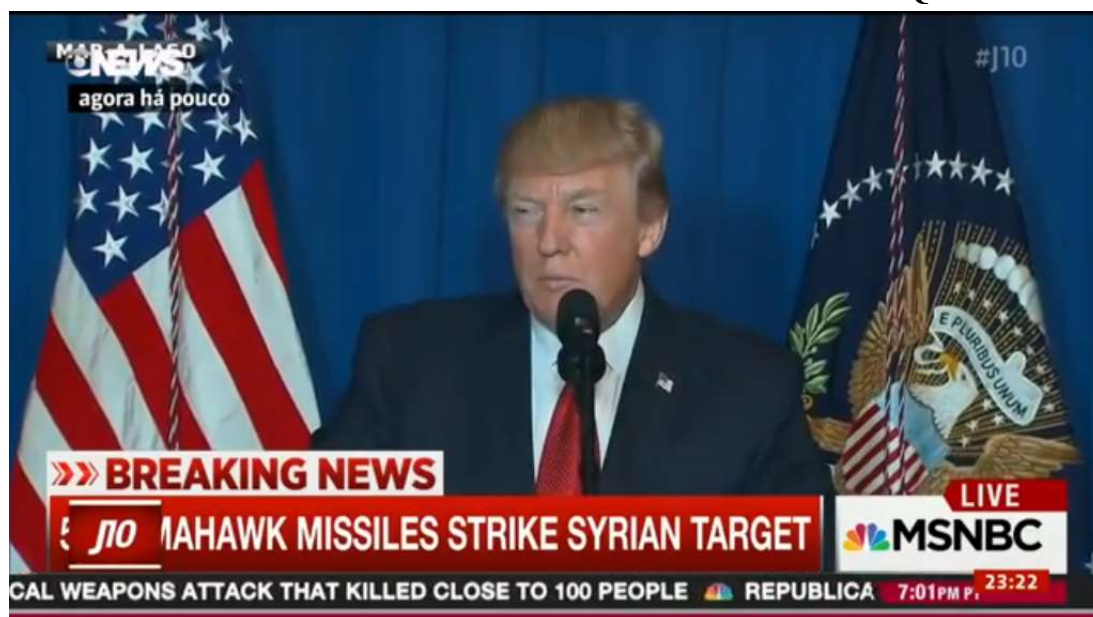
IMAGEM 1: PRESIDENTE DONALD TRUMP ANUNCIA ATAQUE À SÍRIA

Assim vejamos, por exemplo, os recentes ataques à Síria – do qual já mencionamos outrora, neste texto – coordenados pelos EUA, França e Inglaterra. É fato que eles estão ligados a um contexto geopolítico e histórico bem maior que é a própria Guerra na Síria e o governo de Bashar Al-Assad. Em breves palavras, as forças lideradas pelos norte-americanos embarcam na defesa contra a produção e uso de armas químicas, sobretudo após a reação síria aos grupos terroristas que assolam àquele país, revelando uma verdadeira “queda de braço”.