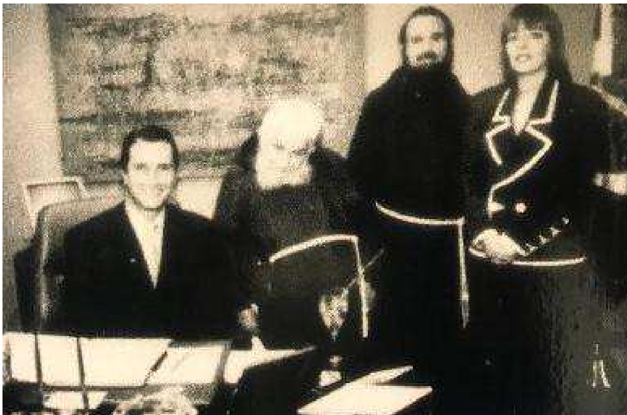
Fernando Collor de Mello recebendo Frei Damião de Bozzano, Frei Fernando e sua secretaria particular.

Dois meses depois da visita de Frei Damião ao gabinete do presidente Collor em Brasília, o frade é acometido por uma doença pulmonar, levando o mesmo a ser internado no Hospital Português na cidade de Recife – PE no dia 31 de Dezembro de 1990 ficando assim durante 4 dias desenvolvendo uma embolia pulmonar, no dia 5 de Janeiro de 1992 após observar que a doença estava evoluindo foi necessário realizar a transferencial para um hospital mais especializado no caso, que foi o Hospital São Paulo, da Escola Paulista de Medicina, onde foi transportado por um helicóptero provido de uma UTI móvel, ao chegar no hospital foi novamente encaminhado para a UTI do hospital, foi emitido um boletim onde o médico pneumologista Miguel Bolssian disse que o estado de saúde do frade era grave porém estável, já que o mesmo estava se alimentando e respirando normalmente sem a ajuda de aparelhos.