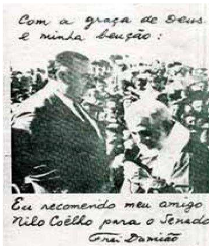
Folheto distribuído a população na eleição de Nilo Coelho.

A trajetória de Frei Damião de Bozzano foi sempre muito movimentada, desde suas missões que movimentavam milhares de pessoas ate as suas influências sobre os vários tipos de poderes sejam ele de caráter religioso ou ate mesmo politico, como assim será citado nesse artigo