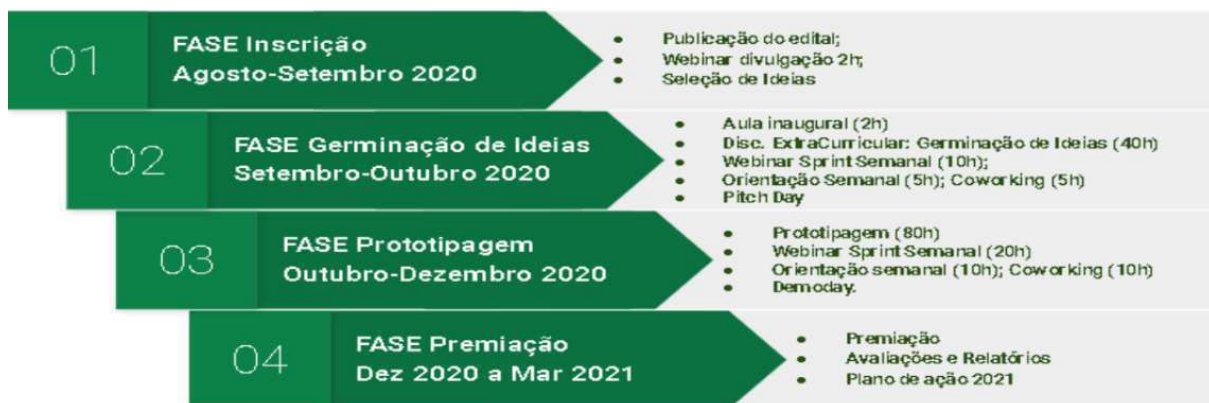
Figura 2- PGINI: Fases e cronograma de execução 2020

O caminho pedagógico do PGINI, é composto de quatro fases e tem início na idealização do problema/solução de mercado e tem conclusão com a apresentação dos protótipos e/ou dos Produtos Mínimos Viáveis (MVP's) validados. Nessa caminhada, a ideia (semente) do negócio precisa passar por um processo de validação, que antecede o período de incubação ou aceleração.