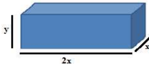
Figura 2 – representação do reservatório de água

Resolução: Indicando-se a largura por x , o comprimento por 2x e a altura por y , obter-se-á a Figura 2: