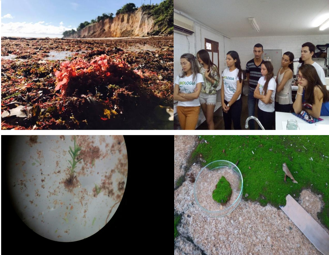
Figura 2 - Imagens das aulas práticas