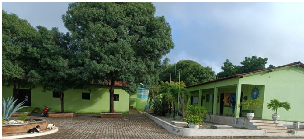
Foto 3 – Frente da Escola Agrotécnica Deputado Evaldo Gonçalves de Queiroz

No módulo II, migramos para outra unidade de educação Básica, pois a escola anterior voltou a ser integral e o preceptor não poderia continuar atuando na mesma, porque também lecionava em outras escolas no município de Sumé. Assim, nosso novo espaço de atuação foi a Escola Agrotécnica de Ensino Fundamental Deputado Evaldo Gonçalves de Queiroz, situada na Rua Luiz Grande, s/n, Bairro Frei Damião, que fica localizada na cidade de Sumé- PB.