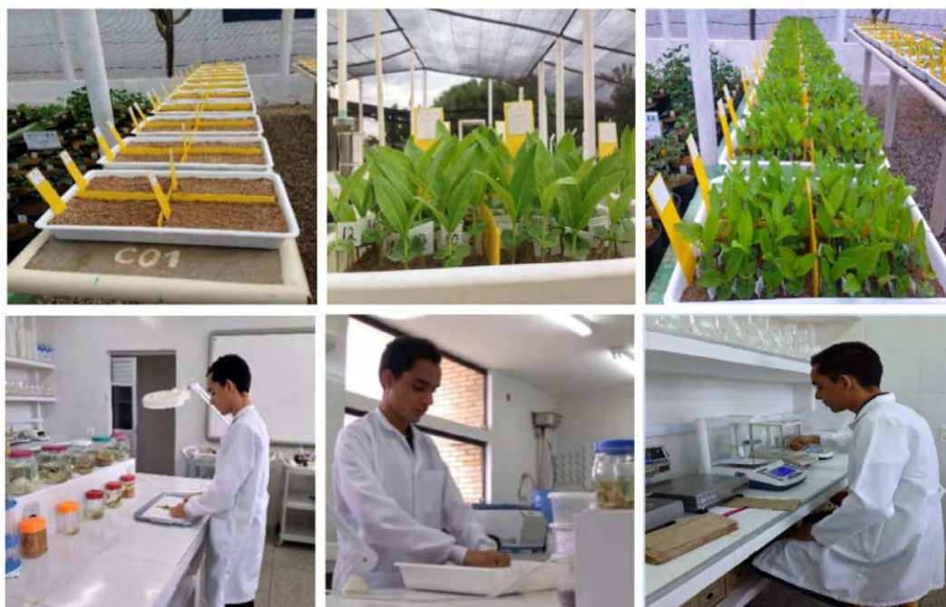
Figura 2 – Procedimentos de avaliação com T. aurea em viveiro e no Laboratório de Ecologia e Botânica (LAEB/UFPG/CDSA).

Trinta dias após o procedimento de semeadura, as plântulas de T. aurea foram avaliadas considerando o diâmetro ao nível do substrato com auxílio de um paquímetro digital de precisão 0,01 mm, comprimento de plântula (parte aérea e raiz), com a utilização de régua graduada. Os resultados de diâmetro e comprimento de plântula foram expressados em mm e cm, na respectiva ordem. Em seguida, os indivíduos foram submetidos à pesagem, sendo utilizado para isso a balança de 0,0001 g de precisão para determinar a massa fresca e, na sequência, foram levados à estufa com secagem programada a 105 °C durante o período de 24 h. Posteriormente, pesou-se novamente para a obtenção da massa seca. Os dados obtidos foram expressos em g por plântula. A Figura 2 (próxima página) faz referência às etapas das avaliações de T. aurea conduzidas em viveiro e em laboratório.