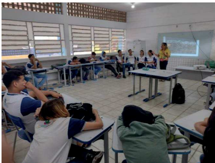
Figura 3 – Registro fotográfico do debate sobre Exclusão Social