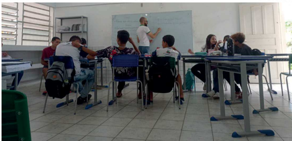
Figura – Registro de regências na turma do 8º ANO B

Tendo concluído o ciclo de três regências voltadas para a temática do gênero dramático com ênfase na tragédia Édipo Rei , a professora sinalizou a ideia de ela mesma dar continuidade ao tema a partir de exercícios de fixação de aprendizagem.