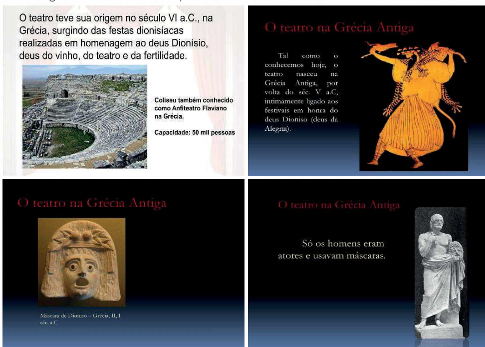
Figura 6 – Alguns slides exibidos na primeira aula.

Seguiu-se para a abordagem de um breve histórico do teatro grego, originado no século VI a.C., surgido das festas dionisíacas realizadas em homenagem ao deus Dionísio, deus do vinho, da alegria e da fertilidade. Os alunos acharam interessante a aula e gostaram muito de conhecer um pouco sobre o deus Dionísio.