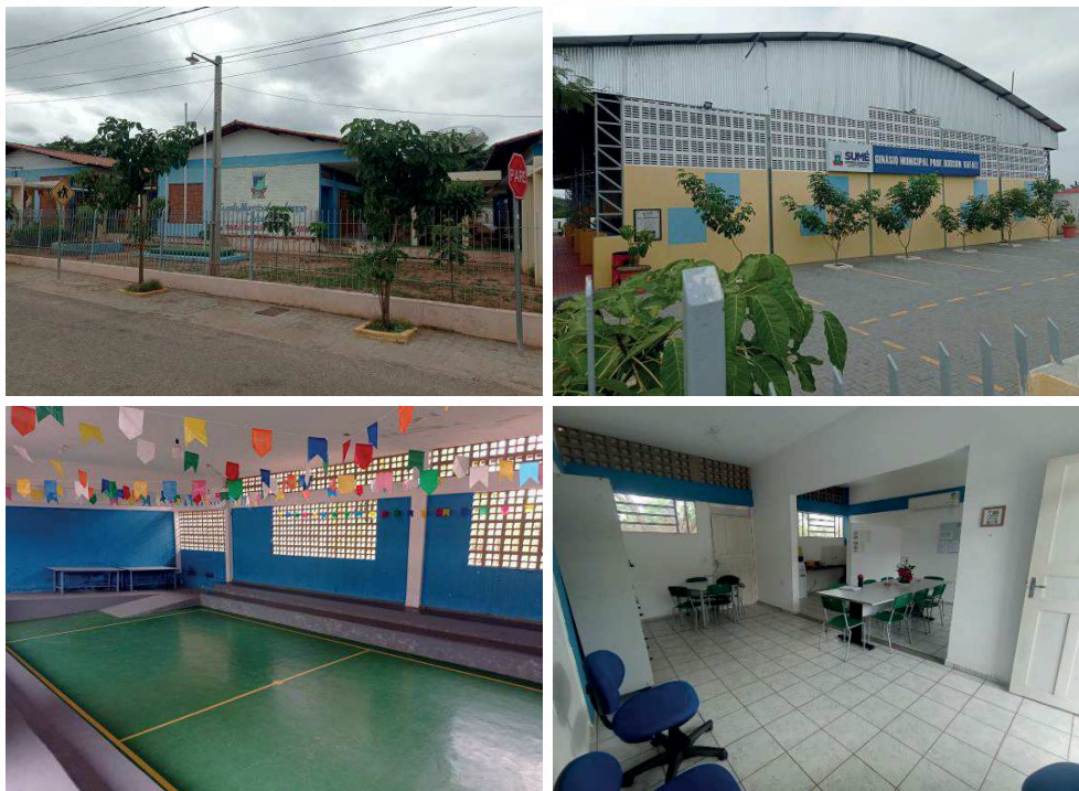
Figura 2 – Imagens de algumas dependências da EMEF Pe. Paulo Roberto de Oliveira.