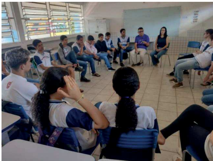
Figura 2 – Registro do debate sobre Inclusão