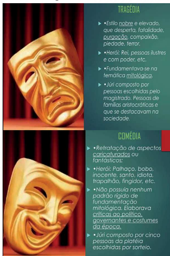
Figura 7 – Alguns slides exibidos na segunda aula

Esses termos fazem total sentido com a temática do gênero tragédia, uma vez que retratam histórias que causam horror, visto que sua finalidade é a purgação das emoções ruins. Trabalhamos algumas características da tragédia, voltadas para o estilo, personagens nobres, temas mitológicos, enredos sanguinários etc. Semelhantemente, abordamos características da comédia, a fim de perceber suas diferenças, uma vez que a comédia surge 50 anos depois, com o intuito de evidenciar figuras caricatas, heróis como pessoas comuns e promover crítica social através do humor.