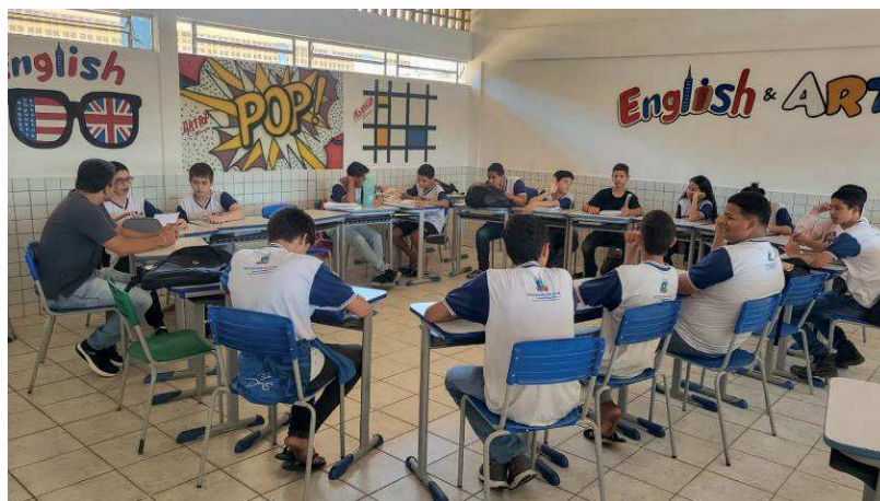
Figura 5 – Registro fotográfico do debate sobre Uso de Celular