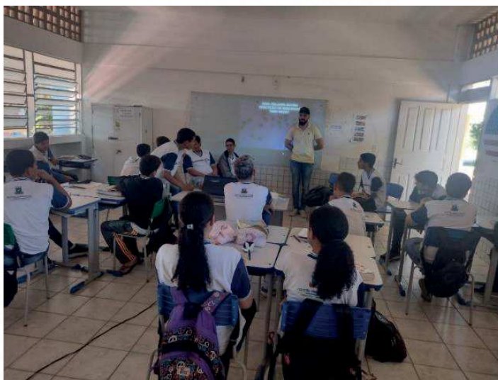
Figura 1 – Registro do debate sobre Educação de Qualidade

Na primeira observação (13/11/2023), na condição de professor de Linguagens e Códigos do quadro efetivo da Secretaria de Educação da Prefeitura Municipal de Sumé-PB e já aproveitando a oportunidade como estagiário, fui convidado a mediar o debate sobre “Educação de Qualidade”. As(os) estudantes fizeram pesquisas sobre a temática e se prepararam para a realização do debate.