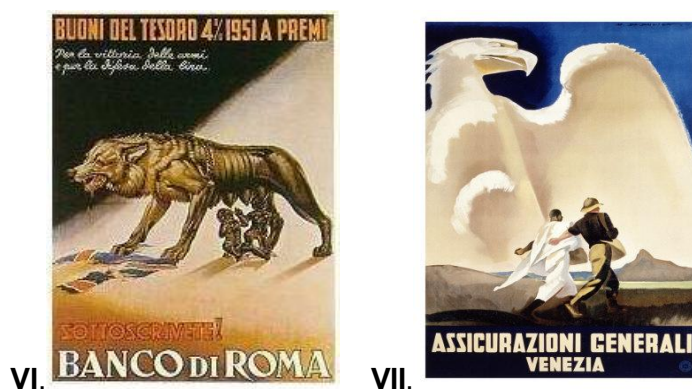
Figura VI: Cartaz de propaganda com a Loba do mito da fundação de Roma. Figura VII: Águia Romana, símbolo do império em cartaz de propaganda.

“Os ideais fascistas, eram inculcados, primeiramente, nos jovens, pois considera-se que as crianças, antes de pertencerem às famílias, pertenciam ao Estado. Na Itália, a partir dos 4 anos, as crianças ingressavam nos ‘Filhos da Loba’ e usavam já uniforme; dos 8 aos 14 faziam parte dos ‘balillas’, aos 14 eram vanguardistas e aos 18 entravam nas Juventudes Fascistas”