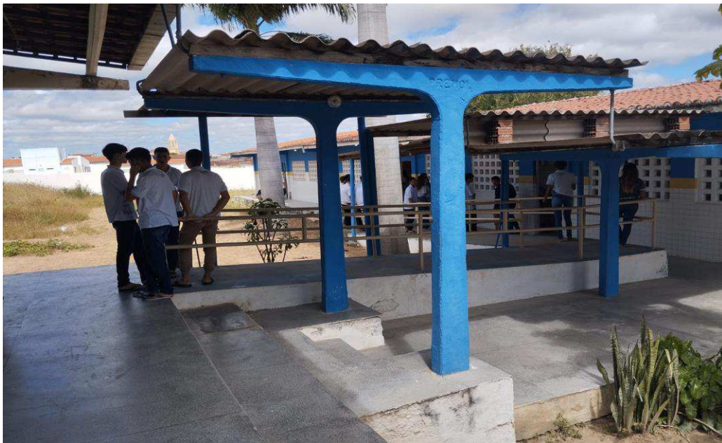
IMAGEM 6- ECIT JOSÉ LUIZ NETO

No ano de 2014, comecei o Ensino Médio, na escola José Luiz Neto na qual estarei estagiando como aluno da Prática de Ensino em História. O Ensino Médio foi um período bem produtivo, tínhamos bons professores, de matemática, filosofia, português, mas, devido a problemas internos na escola acabamos prejudicados na disciplina de história. Principalmente durante a primeira e a segunda série do Ensino Médio, devido a problemas estruturais na escola, o professor de História mudou várias vezes e isso acabou prejudicando o rendimento da turma no ensino de história, e abalando um pouco a paixão que eu tinha pela disciplina. Como ocorria a troca de professores era difícil me acostumar com diferentes didáticas já que em pouco tempo iria mudar de professor, e até ficamos sem professores por um tempo.