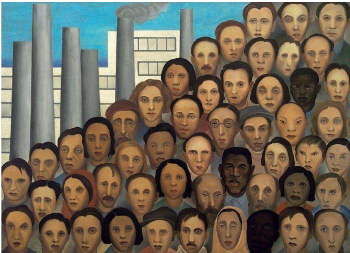
IMAGEM 3- OPERÁRIOS (1933)