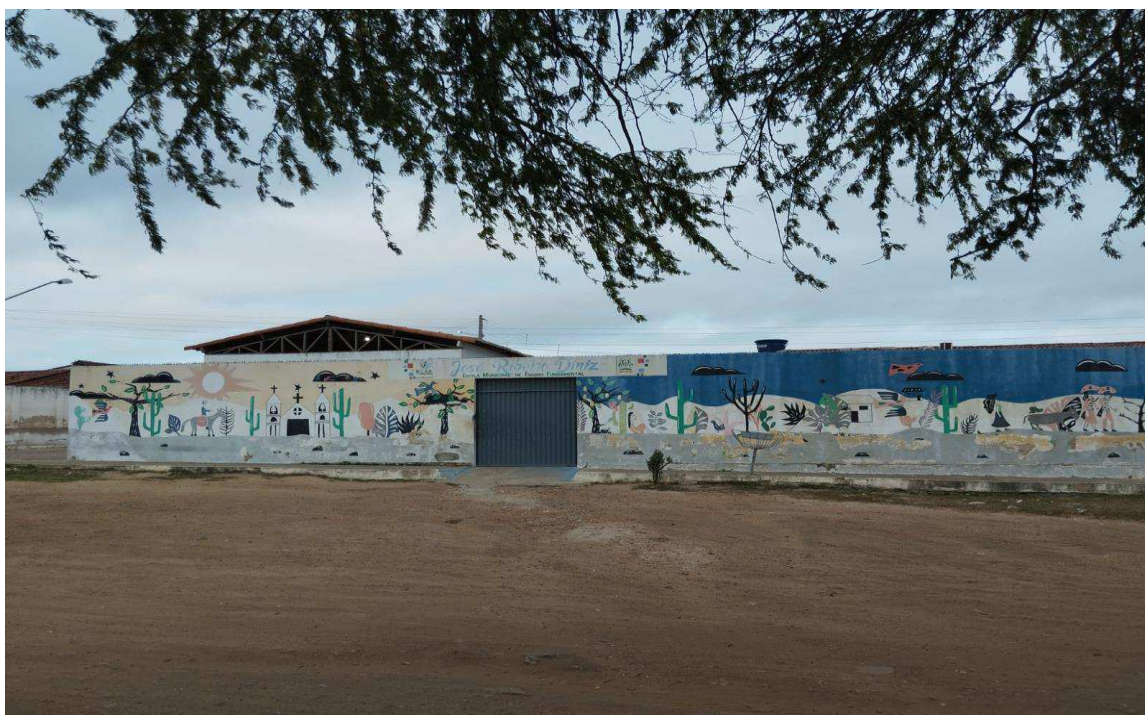
IMAGEM 1- ESCOLA JOSÉ RIBEIRO DINIZ

Quando terminei a pré-escola, como era chamada naquele período, mudei de escola e comecei a estudar na Escola José Ribeiro Diniz, que se encontra no meu bairro que é um pouco longe do centro da cidade. Alguns aspectos foram responsáveis por essa mudança de ambiente escolar, como, à distância, a situação econômica da minha família, meu pai e minha mãe não tinham transporte e ficava inviável que eu estudasse nas escolas do centro, que eram consideradas mais avançadas. Embora fosse uma escola de bairro e com infraestrutura física precária sem tanto reconhecimento na minha cidade, sempre gostei de ter feito parte do corpo discente daquela escola. Tive boas professoras, mulheres muito competentes que buscavam nos ensinar com as mais diversas metodologias. Fui uma criança comunicativa e com muitos amigos e nunca dei muito trabalho às professoras. E foi nessa escola que comecei a me interessar mais nas disciplinas de Arte, História e Ciência, eram as aulas que eu mais me identificava.