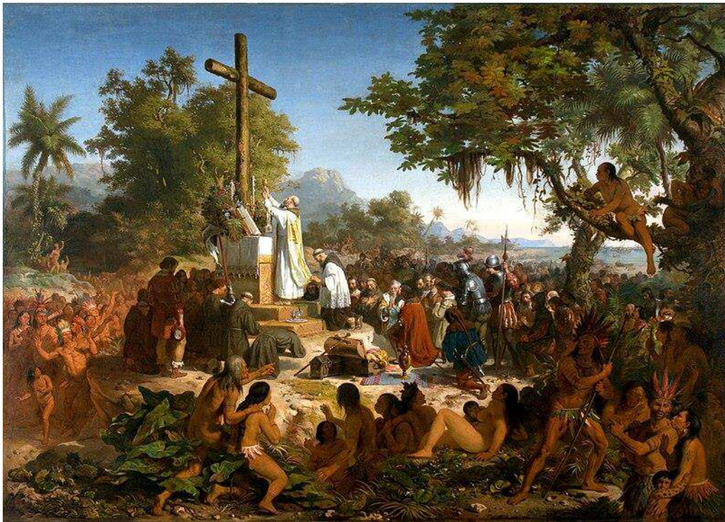
IMAGEM 9- PRIMEIRA MISSA NO BRASIL (1859-1861)

Fonte: Disponível no site: https://pinacotecabasica.blogspot.com/2020/04/primeira-missa-no-brasil1861-victor.html . Acesso em 01/05/2024.