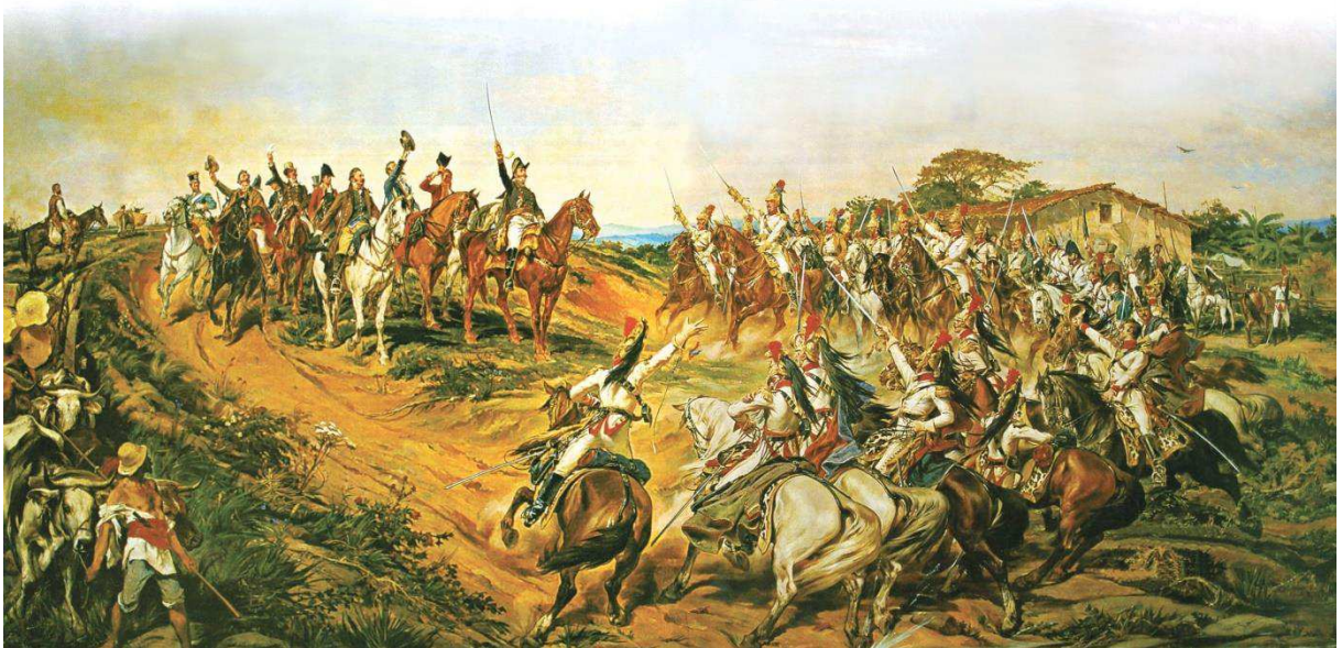
IMAGEM 2- INDEPENDÊNCIA OU MORTE DO PINTOR PEDRO AMÉRICO (1888)