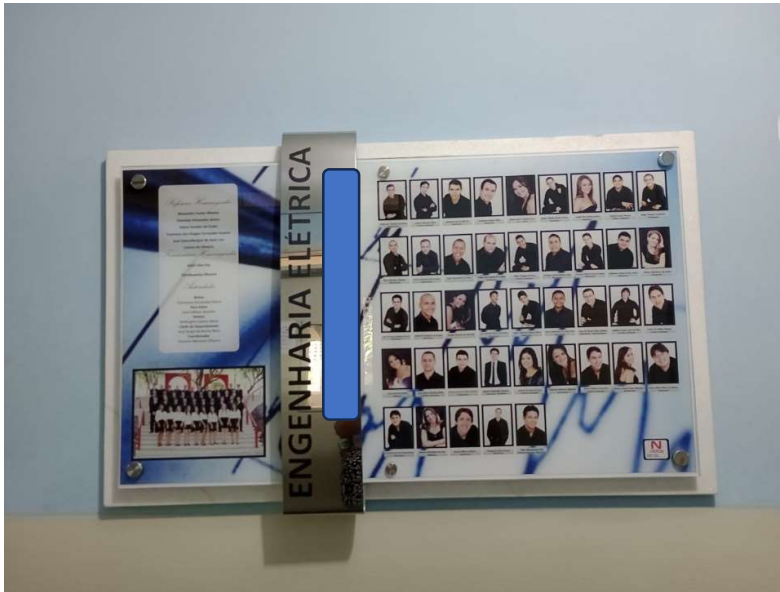
Figura 04: Placa da turma de concluintes de Engenharia Elétrica