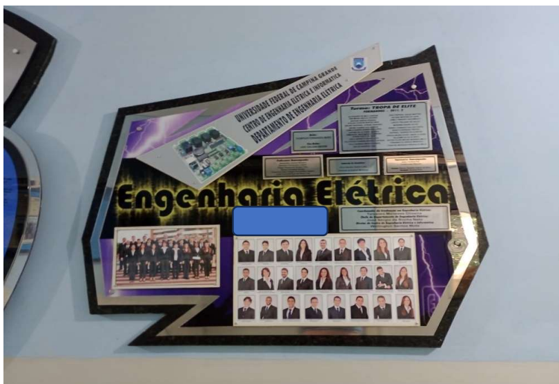
Figura 03: Placa da turma de concluintes de Engenharia Elétrica