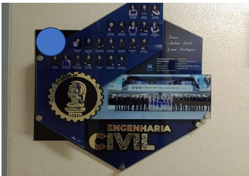
Figura 02: Placa da turma de concluintes Engenharia Civil

Fonte: Unidade Acadêmica do Curso, 2023.