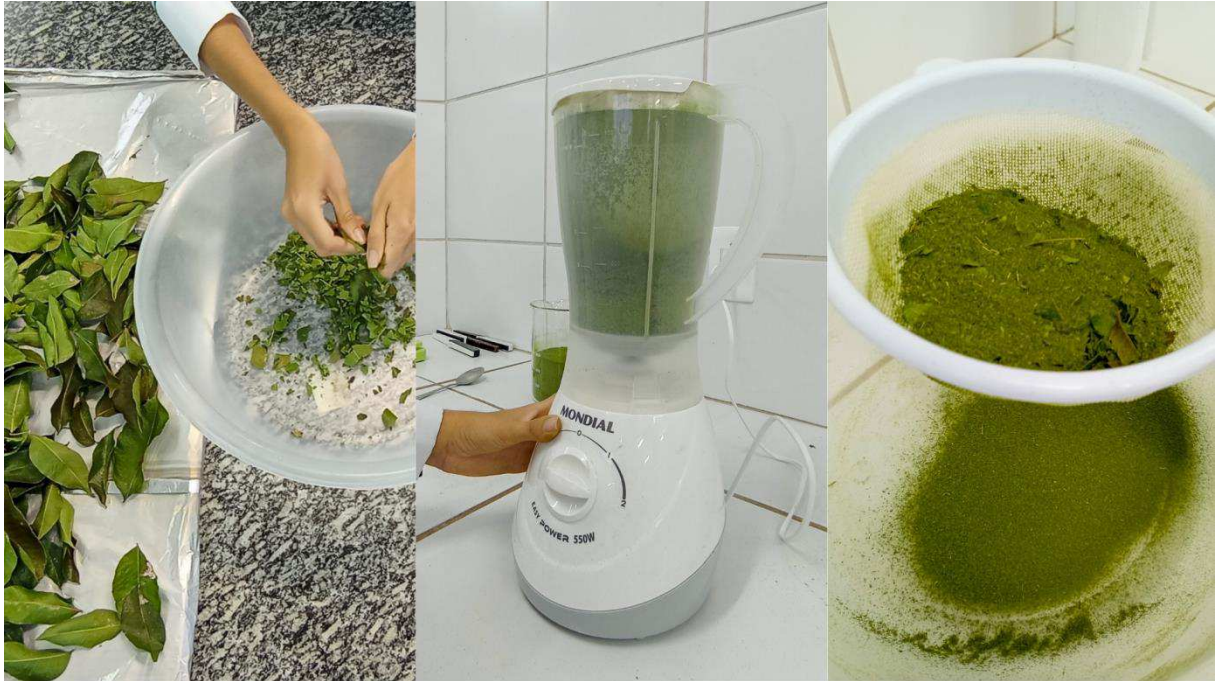
Figura 03- Folhas do limãozinho no processo de trituração e peneiração.

Logo após, foi armazenada em embalagens a vácuo até a produção dos cupcakes(Figura 03 e 04).