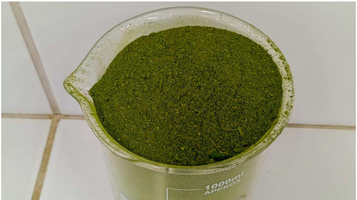
Figura 04- Farinha da folha do limãozinho produzida.