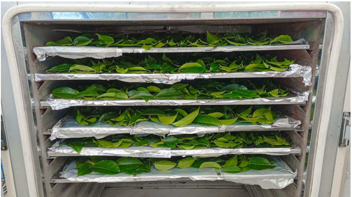
Figura 02- Folhas do limãozinho dispostas na estufa para secagem.