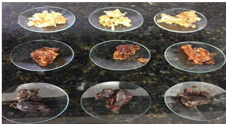
Figura 1 – Triplicata das amostras A, B e C da resina da Albizia lebbeck .

As amostras de resina A, B e C (Figura 1) foram retiradas em três pontos específicos do caule (parte superior, central e parte inferior). Optou-se pela retirada nos diferentes pontos tendo em vista a diferença na coloração da resina. Todos as coletas assim como os experimentos realizados foram feitos no laboratório de química do Centro de Desenvolvimento Sustentável/CDSA da Universidade Federal de Campina Grande/UFCG em Sumé-PB. Os experimentos foram realizados em junho de 2017.