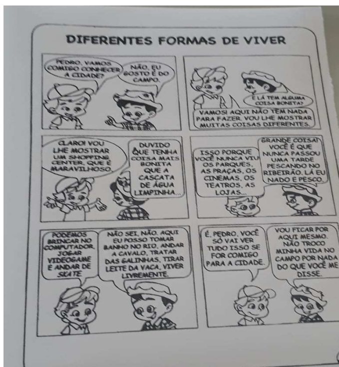
Figura 1 – História em quadrinhos abordada no desenvolvimento do projeto (Fonte: Miranda, Gislayne. A. B/2019)

Inicialmente, contextualizamos a abordagem e abrimos espaço para discussão de alguns pontos de vista sobre a adequação do tema e a forma como a atividade seria trabalhada em sala.