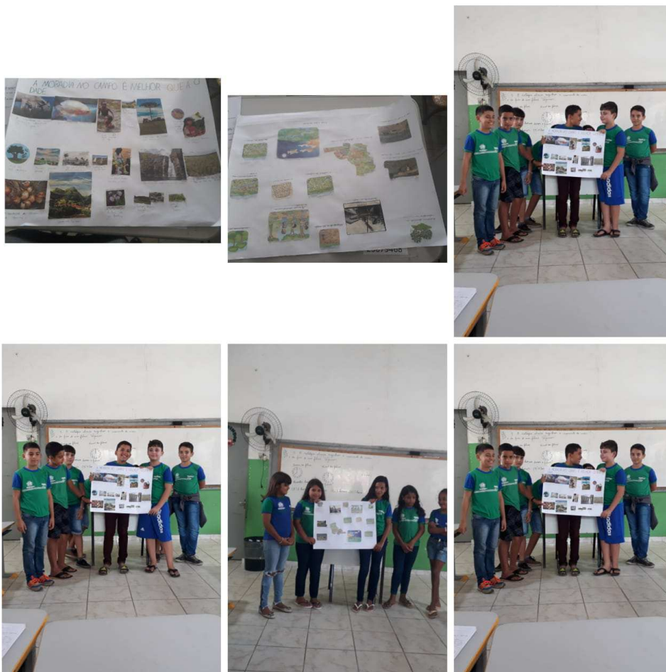
Figura 3 – Culminância do projeto

Durante a aplicação da atividade, observamos nos alunos características comportamentais próprias, demonstrando dedicação, motivação e se esforçando para realizar todas as atividades propostas, o que nos ajudou a perceber o quanto se sentiam acolhidos e seguros dentro do ambiente escolar, passando a ter um sentimento de pertencimento por aquele lugar.