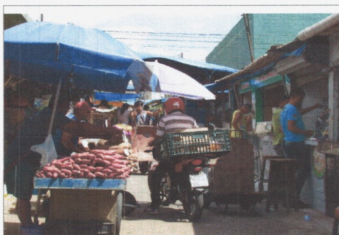
Fotografia 5: A motocicleta no contexto da feira (2018).

A maioria dos feirantes questionados qualificou a estrutura da feira como péssima . Esse resultado vem à tona mediante comparação com os grandes supermercados. Através da realização do inventário, foi possível verificar que há iluminação, saneamento (embora precário), cobertura em alguns lugares, serviço médico, seguranças, banheiros, lixeiras, ventilação e pontos de acesso amplo. Porém, com muitos obstáculos, a exemplo de carroças, motocicletas e ambulantes. Além disso, não existe sinalização. No sábado, dia mais movimento, se torna bastante difícil andar na feira e as vias ficam bastante obstruídas.