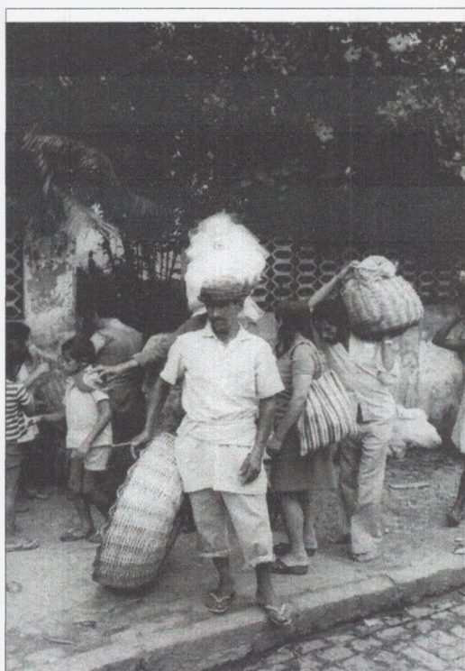
Fotografia 10: “Balaeiro” (1978).

O tempo e as inovações, então, criam sucessivas camadas que sobrepõem-se umas as outras, e que são, por si só, testemunhos da formação de um dado espaço ou fatores sociais, assim como os anéis de crescimento da árvore são testemunhos das condições externas que se internalizam a ela com o avanço das conjunturas. Isto é, rugosidade é tudo aquilo que permanece, e, atentos a isso, podemos identificar as diferentes variações, seja no campo das técnicas de produção ou da própria sociabilidade.