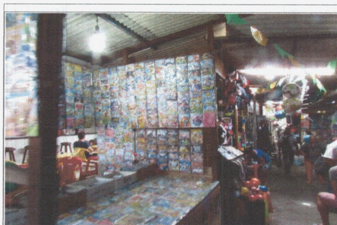
Fotografia 2: Comércio de DVDs piratas na Feira Central de Campina Grande.

De acordo com Andrade (1987, p. 138, apud CARNEIRO, 2014, P. 45), “a feira é ponto de encontro entre o meio rural e o urbano”. Neste momento, iremos além: a feira é ponto de encontro do sistema com a vida; no sentido de que o primeiro tenta colonizar a segunda, e a mesma se serve dos seus meios técnicos, permitindo-lhe exercer sobre o sistema uma espécie de contra-ataque. Isto é facilmente observável na reprodução e venda de DVDs piratas, por exemplo, prática presente na Feira Central de Campina Grande: