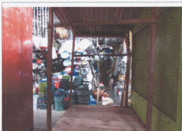
Fotografia 9: Utensílios para uso domiciliar.

Contudo, apesar dos impactos percebidos através deste passeio possibilitado por nossa breve interpretação iconológica, ainda é possível captar a Feira Central de Campina Grande como um local de resistência, tendo em vista que abriga milhares de feirantes que continuam mantendo essas práticas, mesmo que não desejem repassá-las aos seus filhos – coisa que ocorre por questões de sobrevivência 32 num mundo em processo de colonização pelo sistema. Desta forma,