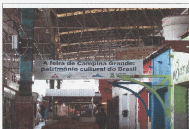
Fotografia 4: Mercado Central (2018).

De acordo com o Art. 3º, o comitê gestor foi constituído por representantes dos feirantes, com os respectivos suplentes, eleitos em fórum deliberativo, representados pela concordância de diversos setores da feira. Também é constituído por representantes do poder público e demais entidades da sociedade civil, indicados pela autoridade competente. Secretaria de Cultura, Secretaria de Educação, SESUMA, SEPLAN, Coordenadoria de Turismo, UFCG, UEPB, Associação dos Feirantes, Instituto Solidarium e o Inventário Nacional de Referências Culturais da Feira de Campina Grande estão inclusos.