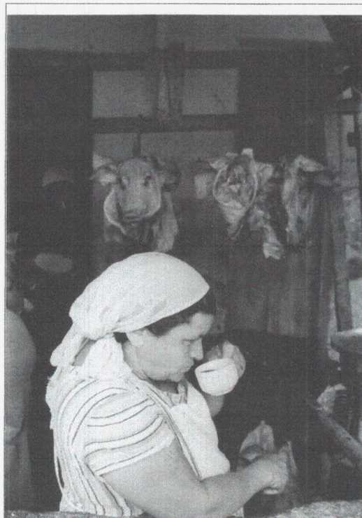
Fotografia 6: Cafezinho (1978).

A intenção de Coura com o seu ensaio foi a de transmitir o cotidiano 31 da feira central, enaltecendo-o da forma mais natural possível. Para isso, buscou inserir-se nesse cotidiano com um método voltado para a participatividade, bastante parecido com o usado pelos antropólogos ao estudarem grupos humanos. A fotografia abaixo é bastante representativa no que se refere a atitude dos feirantes em relação ao fotógrafo, que em determinados momentos, passaram a não se importar com a presença das lentes.