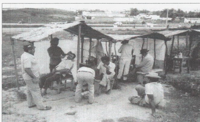
Fotografia 11: "Pela-porco" (1978).

Muito embora, na verdade, a posição discursiva do letrado em alguns casos acabasse favorecendo os elementos do circuito superior em detrimento do inferior, reforçado pela cultura popular – sem estabelecer uma relação dicotômica direta com a cultura popular; esta relação dicotômica é estabelecida e fomentada pela cultura de massas.