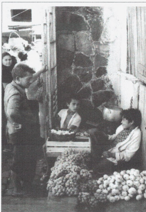
Fotografia 7: Jovens feirantes negociando frutas e verduras (1978).

Hoje em dia, como visto anteriormente neste trabalho – de acordo com informações dos questionários – as pessoas mais jovens, imersas com mais intensidade na mentalidade moderna (também discutida anteriormente por nós) apresentam uma certa rejeição a feira. Do mesmo modo, a maior parte dos feirantes questionados disse que não desejavam que seus filhos e netos seguissem o mesmo ofício. Este desejo de continuísmo não se verifica, como também foi percebido por Araújo (2006, p. 65).