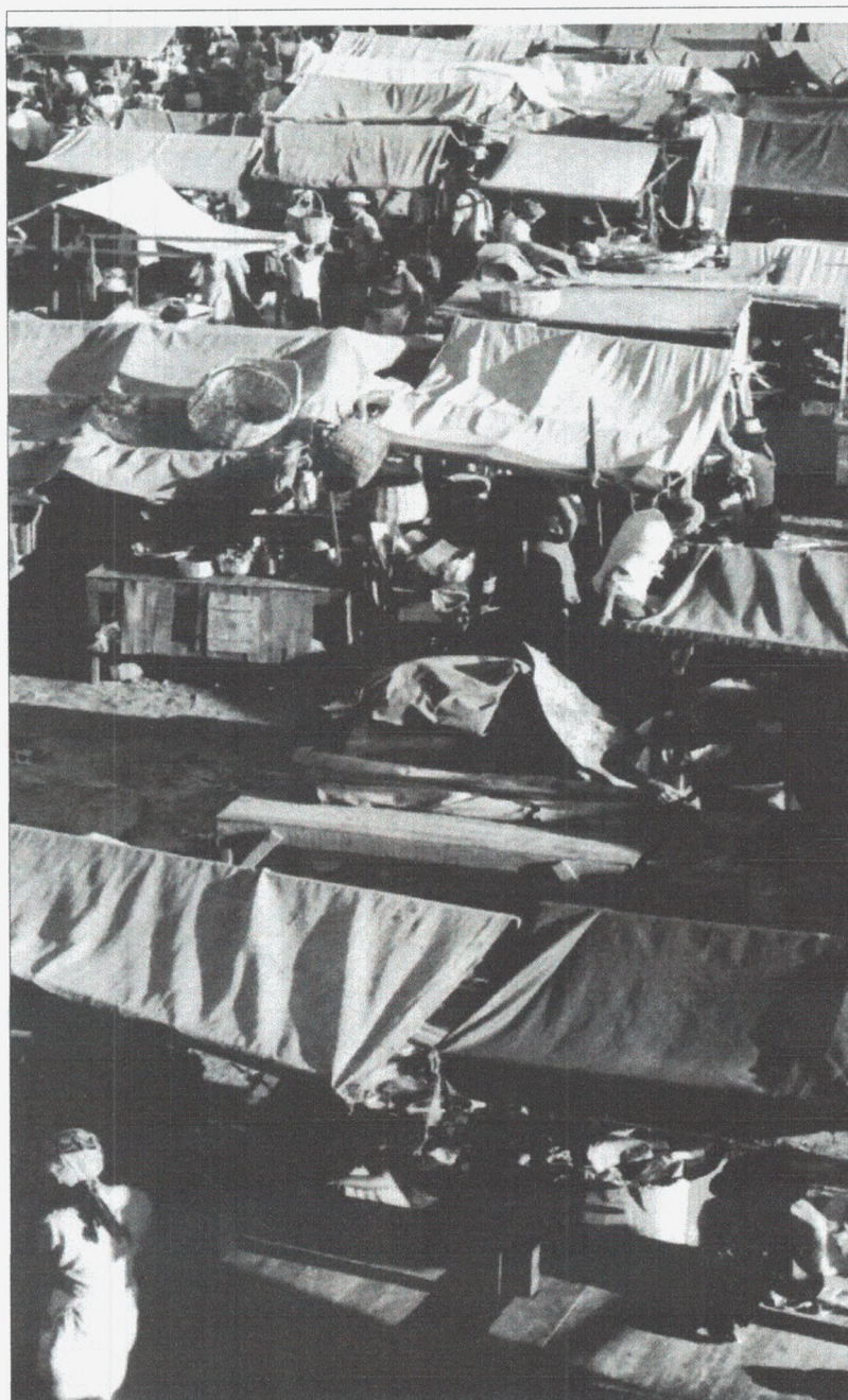
Fotografia 1: A Feira Livre de Campina Grande (COURA, 1978).