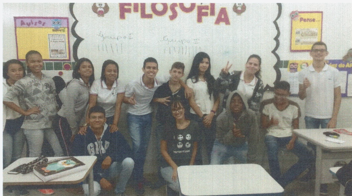
Imagem 5. Foto tirada no último dia do estágio com a turma do 1º ano A.