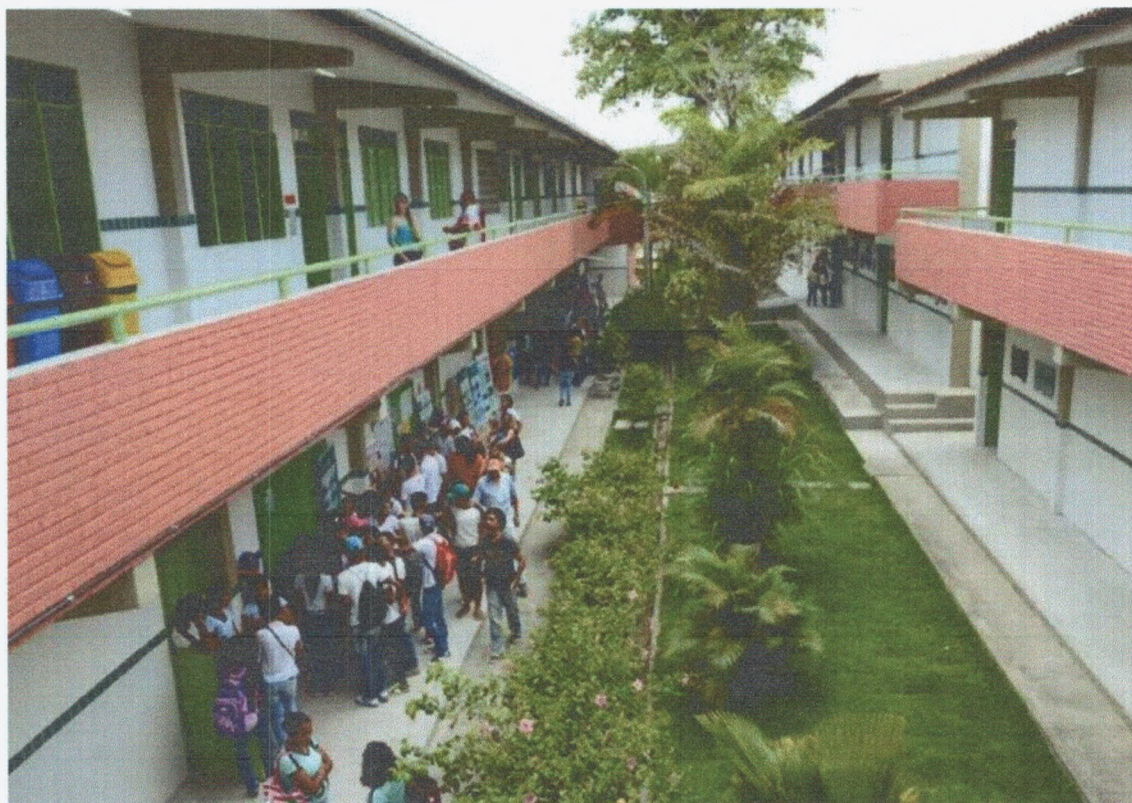
Imagem 1. Vista do 1º andar da Escola Cidadã Integral Nenzinha Cunha Lima