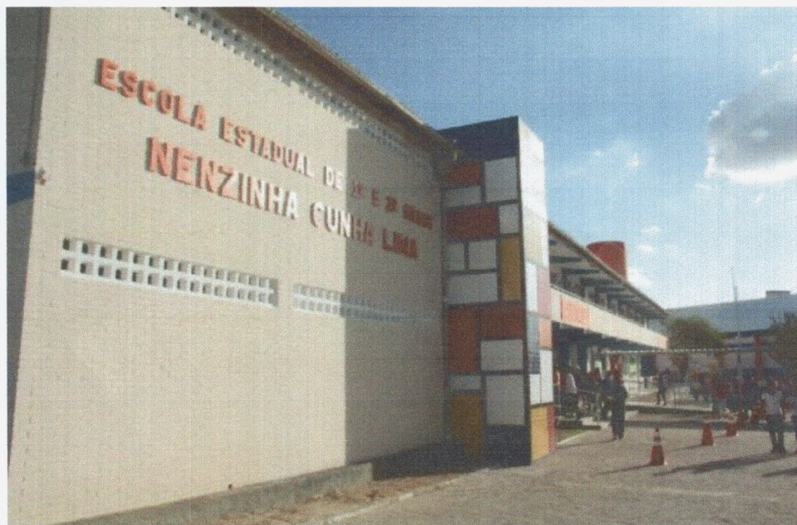
Imagem 2. Fachada da ECI Nenzinha Cunha Lima.