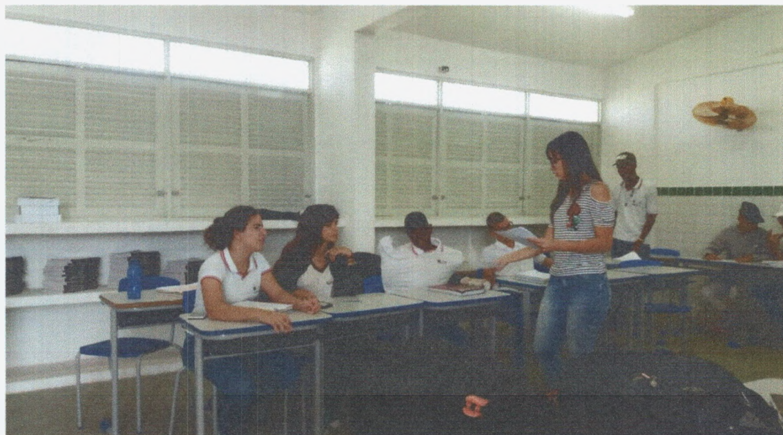
Imagem 3. Foto tirada pela professora Ariosvânia em uma das aulas ministradas por mim.