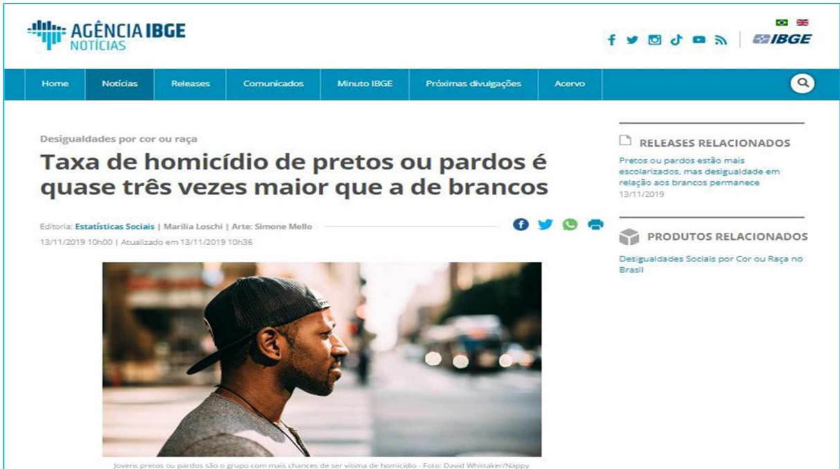
Imagem 1: Taxa de homicídio de pretos e pardos.