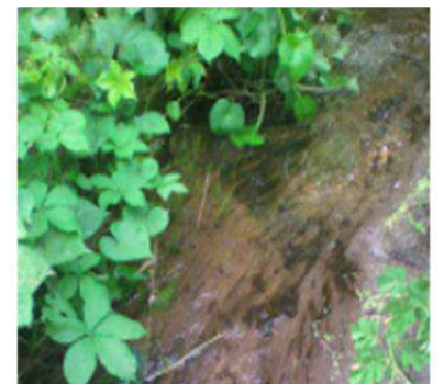
Acervo fotográfico do Autor (2020)

Terão um papel fundamental na logística da produção de mudas e insumos, necessários para restauração ou recuperação das áreas degradadas.