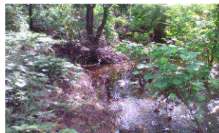
Conservação dos recursos hídricos

Garantem o equilíbrio da temperatura e umidade do Solo