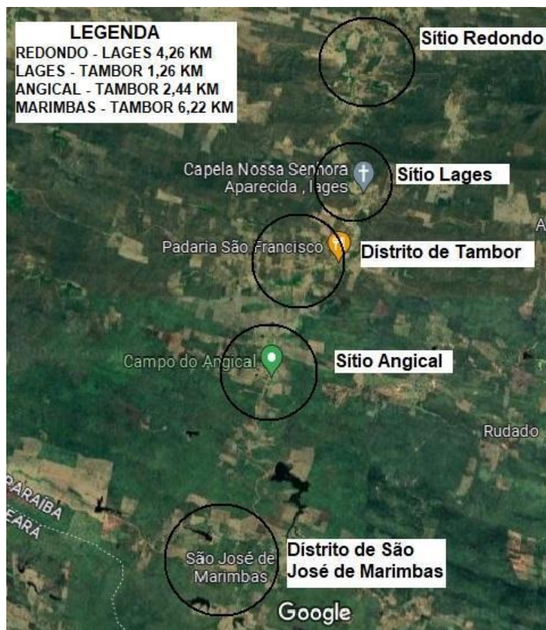
Mapa da zona rural de Cachoeira dos Índios - PB

As manifestações culturais da comunidade do distrito de Tambor ocorrem principalmente no período junino (Santo Antônio, São João e São Pedro) e na festa do Santo Padroeiro da comunidade, (São Francisco). Durante a realização das festividades desenvolvidas na escola João Izidro de Sousa, a comunidade tem a oportunidade de prestigiar os alunos no desenvolvimento dos trabalhos escolares e apresentações artísticas e suas respectivas manifestações culturais.