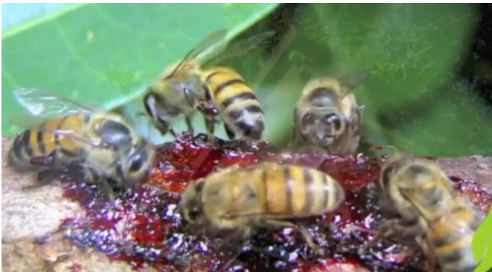
Figura 01: Coleta da resina Dalbergia ecastophyllum por abelhas Apis mellifera para posterior produção de própolis vermelha

Para Abreu et al. (2021) nota-se que em virtude da grande diversidade da sua flora, a própolis brasileira está classificada em 13 (treze) tipos, de acordo com a sua constituição química e também pela avaliação de suas atividades antimicrobianas e antioxidantes. A própolis encontrada mais recentemente é classificada como 13º tipo e denominada de própolis vermelha, devido a sua coloração vermelha intensa. A principal origem botânica deste tipo de própolis é a planta Dalbergia ecastophyllum , encontrada ao longo do mar e costa de rios no Nordeste brasileiro e sua coloração se deve, principalmente, pela coleta das abelhas, do exsudado vermelho da superfície da D. ecastophyllum , como pode ser observado na Figura 01.