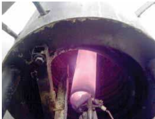
FIGURA 32 | Uso da energia térmica do biogás para o aquecimento da água para banho doméstico.

(Granja Palma Sola - SC - Cooperativa Alfa – Sistema Aurora, 27 maio 2015). Visita realizada pela equipe de consultores do Projeto Suinocultura de Baixa Emissão de Carbono.