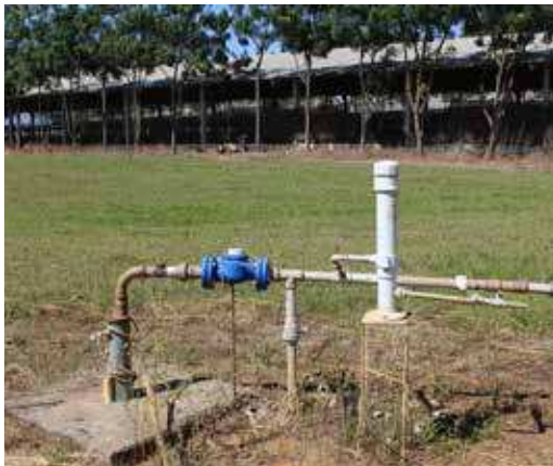
FIGURA 01 | Hidrômetro para controlar o volume de água consumida na unidade (equipamento de cor azul) e clorador para tratar a água obtida do lençol freático (equipamento de cor branca)

Fonte: Cleandro Pazinato Dias. Fazenda Mano Júlio - MT (visita realizada pela equipe de consultores do Projeto Suinocultura de Baixa Emissão de Carbono em 2 julho 2015).