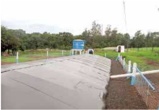
FIGURA 05 | Cisterna de armazenagem de água da chuva e caixa de água