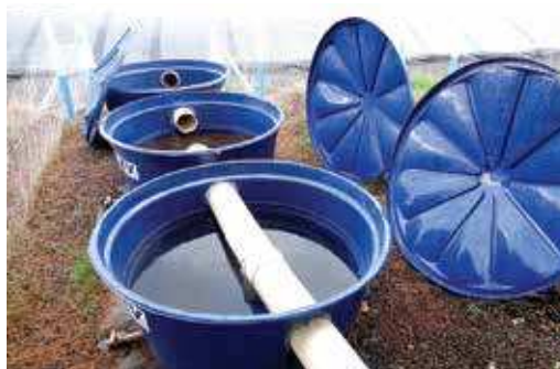
FIGURA 04 | Conjunto de filtros utilizados para limpeza da água da chuva antes da armazenagem nas cisternas