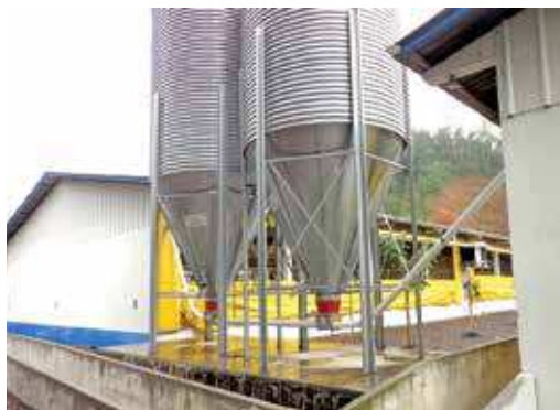
FIGURA 07 | Conjunto de silos de armazenagem de ração. Quanto mais fases ou tipos de rações existirem, mais ajustado estará o fornecimento de nutrientes com a demanda dos animais.