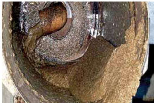
FIGURA 13 | Separação de dejetos suínos utilizando peneiras

Estes mecanismos de separação dos dejetos podem operar com uma concentração maior de sólidos nos dejetos. As peneiras rotativas (Figura 13) operam de forma contínua com pequena ou nenhuma obstrução dos crivos e com capacidade de remover partículas grossas e finas.