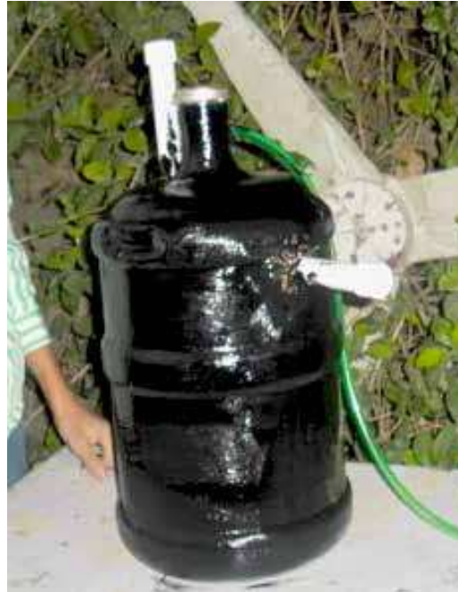
FIGURA 25 | Montagem do biodigestor caseiro: passo 8

Para aumentar a temperatura dentro do biodigestor e evitar que a incidência de luz solar estimule a criação de algas, prejudicando a produção de biogás, é recomendável pintar toda a parte externa do galão com tinta de cor preta.