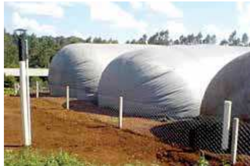
FIGURA 15 | Biodigestor de batelada em funcionamento

Fonte: Cleandro Pazinato Dias. Granja Thomazzoni – SC. (visita realizada pela equipe de consultores do Projeto Suinocultura de Baixa Emissão de Carbono dia 28 maio 2015).