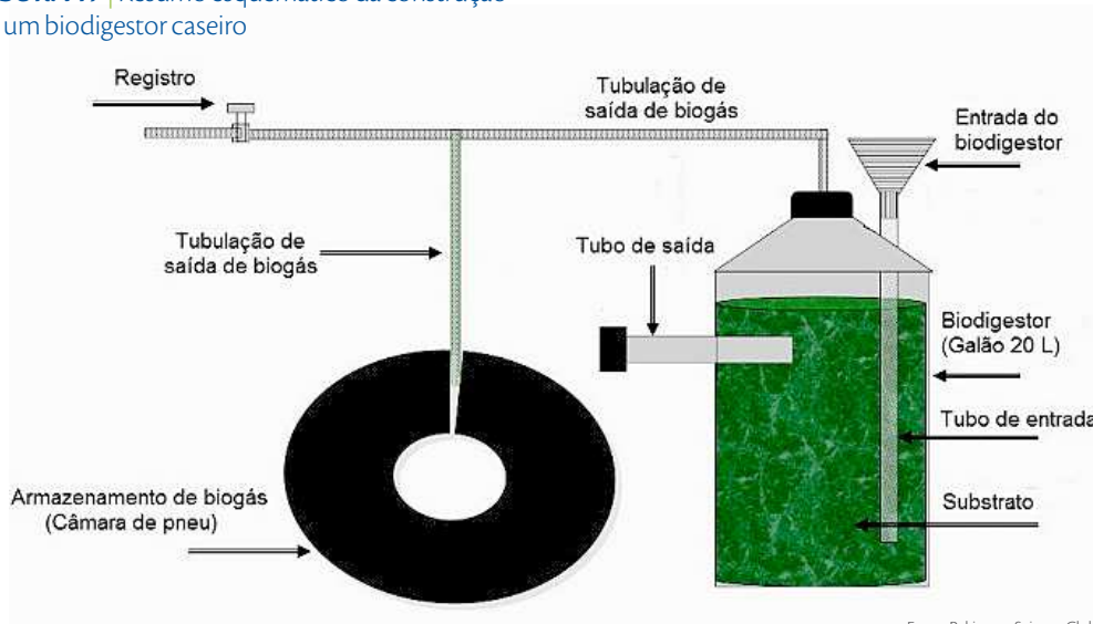
FIGURA 17 | Resumo esquemático da construção de um biodigestor caseiro

Uma alternativa para as pequenas propriedades é a construção de um biodigestor caseiro. Na figura 17 é apresentado um resumo esquemático do passo a passo de como um suinocultor pode construir um biodigestor na sua propriedade rural. O esquema proposto é baseado em Pakistan Science Club (2012).