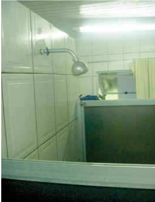
FIGURA 33 | Chuveiro com água aquecida com a energia térmica gerada a partir do biogás

(Granja Palma Sola - SC - Cooperativa Alfa – Sistema Aurora, 27 maio 2015). Visita realizada pela equipe de consultores do Projeto Suinocultura de Baixa Emissão de Carbono.