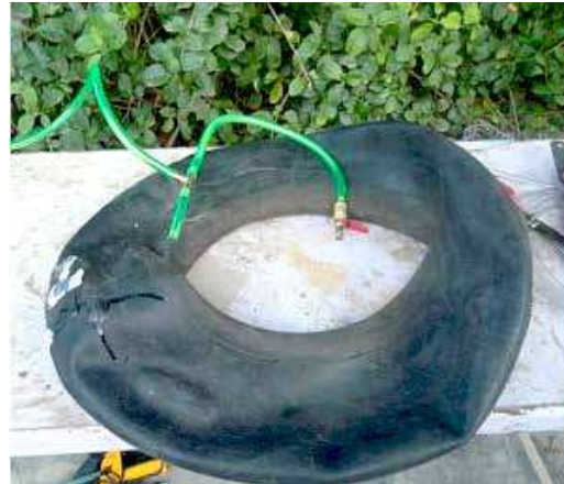
FIGURA 23 | Montagem do biodigestor caseiro: passo 6

Corte a tubulação maleável de ¼" e conecte uma ponta na parte central do tee de ¼". Em uma das pontas do tee conecte um pedaço da tubulação de ¼" e em seguida conecte a câmara de pneu. Na outra extremidade do tee conecte o restante da tubulação de ¼" e na extremidade final da tubulação conecte a válvula com registro de ¼".