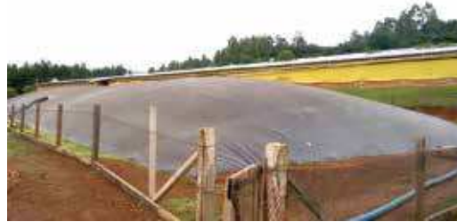
FIGURA 14 | Biodigestor modelo canadense em funcionamento

Fonte: Cleandro Pazinato Dias. Granja Thomazzoni – SC. (visita realizada pela equipe de consultores do Projeto Suinocultura de Baixa Emissão de Carbono dia 28 maio 2015).