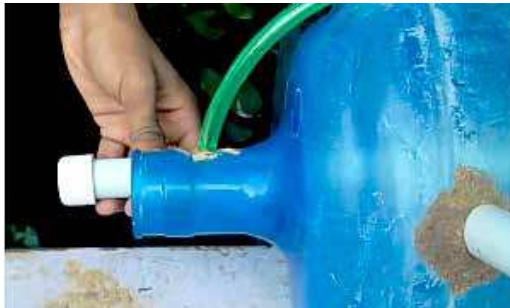
FIGURA 22 | Montagem do biodigestor caseiro: passo 5

Para a saída de biogás, faça uma abertura lateral no gargalo do galão com diâmetro de 0,6cm. Encaixe a tubulação maleável de ¼" e fixe da mesma maneira como foi realizado anteriormente, com areia e cola.