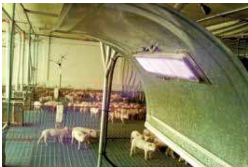
FIGURA 31 | Uso da energia térmica do biogás para o aquecimento de suínos.

(Granja Palma Sola - SC - Cooperativa Alfa – Sistema Aurora, 27 maio 2015). Visita realizada pela equipe de consultores do Projeto Suinocultura de Baixa Emissão de Carbono.