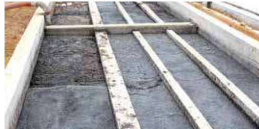
FIGURA 12 | Decantador de alvenaria utilizado para fazer a separação das fases dos dejetos suínos