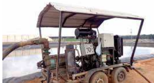
FIGURA 35 | Gerador de energia elétrica movido a biogás

(Fazenda Seis Amigos – MT, 30 jun. 2015). Visita realizada pela equipe de consultores do Projeto Suinocultura de Baixa Emissão de Carbono.