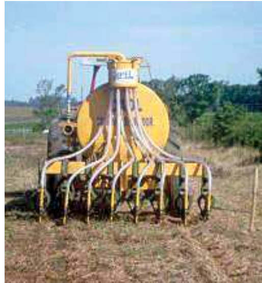
FIGURA 26 | Distribuição de biofertilizante na lavoura.