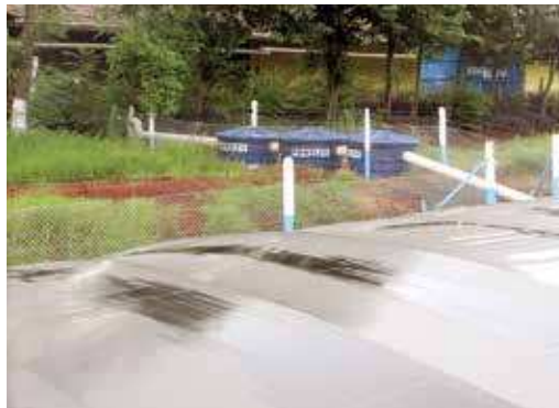
FIGURA 03 | Sistema de captação da água chuva que cai no telhado da granja, filtragem da água coletada e cisterna