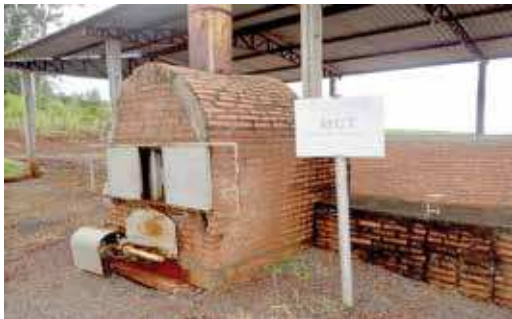
FIGURA 30 | Secador de grãos que utiliza a calor gerado pela queima do biogás