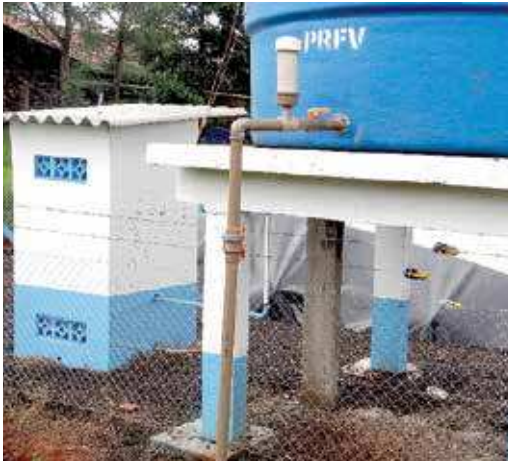
FIGURA 06 | Caixa d'água com clorador acoplado