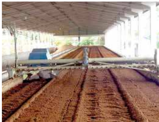
FIGURA 10 | Compostagem mecanizada e automatizada de dejetos suínos

Granja Pizzato – SC (visita realizada pela equipe de consultores do Projeto Suinocultura de Baixa Emissão de Carbono em 26 maio 2015).