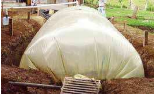
FIGURA 16 | Biodigestor do tipo bolsa, equipamento pode ser adquirido pronto