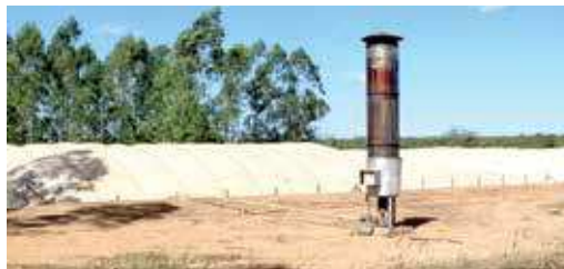
FIGURA 28 | Biodigestores acoplados ao queimador de biogás (flare)

Fonte: Cleandro Pazinato Dias. (Fazenda Mano Júlio – MT, 2 jul. 2015). Visita realizada pela equipe de consultores do Projeto Suinocultura de Baixa Emissão de Carbono