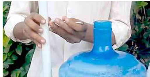
FIGURA 18 | Montagem do biodigestor caseiro: passo 1

Corte o tubo de PVC de \frac{3}{4} " para que este fique na mesma altura do gargalo do galão.