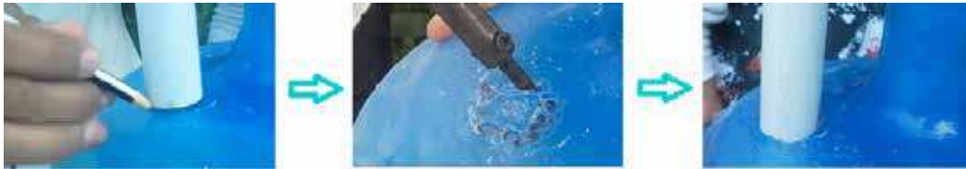
FIGURA 19 | Montagem do biodigestor caseiro: passo 2