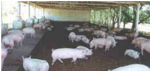
FIGURA 11 | Lote de suínos em fase de crescimento/terminação criados no sistema de cama sobreposta

O composto orgânico produzido apresenta alto valor agrônômico, podendo ser armazenado por longos períodos ou mesmo distribuído na lavoura após a remoção dos animais. A Figura 11 demonstra este processo.