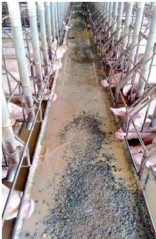
FIGURA 08 | Desperdício de ração no setor de gestação.