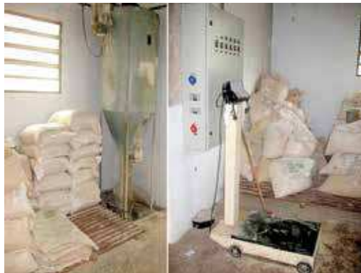
FIGURA 09 | Pequena fábrica de rações equipada com balança para pesagem das rações a serem fornecidas aos suínos.