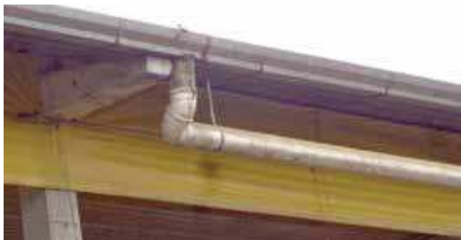
FIGURA 02 | Calhas de captação da água chuva do telhado da granja

Fonte: Cleandro Pazinato Dias. Granja Pizzato – SC (visita realizada pela equipe de consultores do Projeto Suinocultura de Baixa Emissão de Carbono em 26 maio 2015).