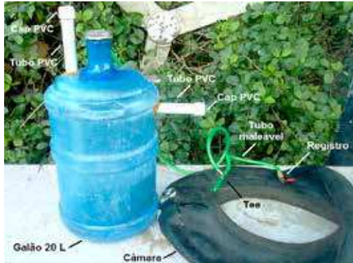
FIGURA 24 | Montagem do biodigestor caseiro: passo 7