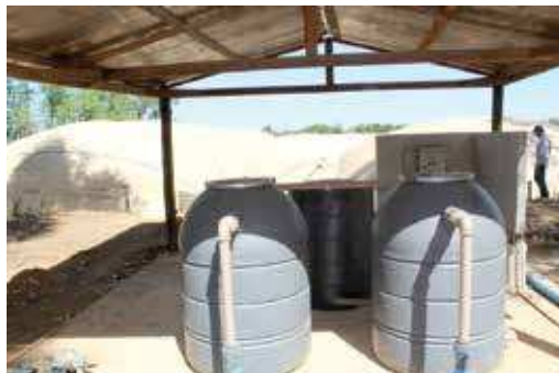
FIGURA 29 | Conjunto de filtros utilizados para reduzir a concentração de gás sulfídrico (H 2 S)

Fonte: Cleandro Pazinato Dias. (Fazenda Mano Júlio – MT, 2 jul. 2015). Visita realizada pela equipe de consultores do Projeto Suinocultura de Baixa Emissão de Carbono