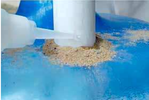
FIGURA 21 | Montagem do biodigestor caseiro: passo 4