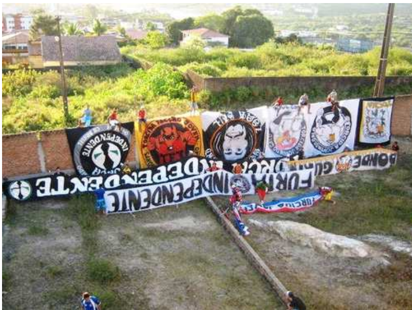
FIGURA 1- BANDEIRAS E FAIXAS DE TORCIDAS RIVAIS CONFISCADAS EM CONFRONTOS NAS RUAS