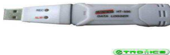
Figura 8. Datalogger Instrutherm HT 500® (B), utilizado para coletas de temperatura ambiente, umidade relativa do ar e temperatura de ponto de orvalho, respectivamente.

Os parâmetros ambientais, temperatura do ambiente (TA), umidade relativa do ar (UR), temperatura de globo negro (TGN) e temperatura do ponto de orvalho (TPO), foram obtidos automaticamente no microclima de cada tratamento por dataloggers HT-500 (Figura 8), a cada duas horas instalados em lugares estratégicos durante todo o período experimental (BUFFINGTON et al., 1981), Com Sombra (CS) e Sem Sombra (SS) a 0,60 m acima do nível do piso.