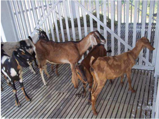
Figura 4. Animais mantidos à sombra

largura com 0,50 m de altura (Figura 6). Os animais - SS foram mantidos em piquete medindo 16 m 2 sem acesso à sombra, também provido de bebedouro e cocho de madeira com as mesmas dimensões (Figura 7).