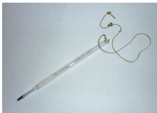
Figura 10. Termômetro clínico veterinário

Para obtenção da temperatura retal (°C) foi utilizado um termômetro clínico veterinário com escala até 44 ° Celsius (Figura 10), introduzido 5 cm no reto do animal durante dois minutos e o resultado da leitura expresso em graus Celsius (°C).