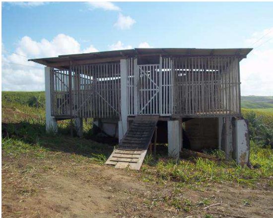
Figura 6. Instalação com acesso à sombra