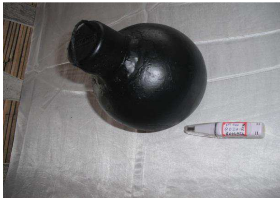
Figura 9. Globo negro com sensor

Com auxílio de outro “Medidor de Stress Térmico” datalogger HT-500, instalado dentro de uma esfera oca de plástico com 5 mm de espessura e 0,15 m de diâmetro enegrecida com tinta preta fosca (Figura 9) de alta capacidade de absorção em cada tratamento experimental (Com Sombra – CS e Sem Sombra – SS), a 0,60 m acima do nível do piso, registrou-se a temperatura do globo negro para cálculo do índice de temperatura de globo e umidade (ITGU).