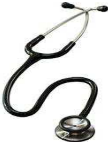
Figura 11. Estetoscópio

A frequência cardíaca foi determinada por auscultação e contagem dos batimentos cardíacos, com um estetoscópio clínico veterinário (Figura 11), diretamente na região torácica esquerda contando-se o número de batimentos durante um minuto para a determinação da FC em batimentos por minuto (bat. min -1 ).