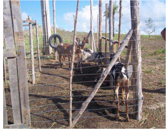
Figura 5. Animais expostos ao sol