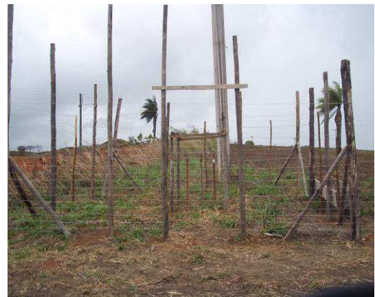
Figura 7. Instalação sem acesso à sombra