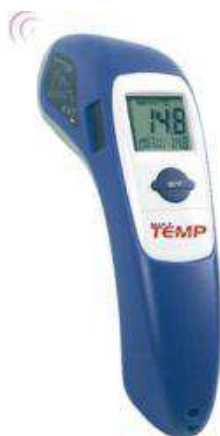
Figura 12. Termômetro infravermelho Mult tempmarca Incoterm

A temperatura superficial do pelame ( ^{\circ}\text{C} ) foi obtida através das médias da temperatura em cinco regiões do corpo de cada animal, com auxílio de um termômetro tipo laser digital elemento expansão infravermelho mira laser (Figura 12), acionado em uma distância de 0,60 m dos pontos de mensuração no animal, tais como: dorso, costado, frente, canela e pescoço.