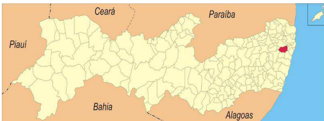
Figura 2. Mapa de localização de São Lourenço da Mata em Pernambuco

O experimento foi desenvolvido no município de São Lourenço da Mata, Pernambuco (Figura 2) no período de janeiro a março de 2012 (estação seca) e maio a julho de 2012 (estação chuvosa) no Colégio Agrícola Dom Agostinho Ikas/Tiúma/Universidade Federal Rural de Pernambuco (Figura 3). O município está localizado na região Litoral/Mata, Microrregião Metropolitana a uma latitude 08°00'08" sul, longitude 35°01'06" oeste e uma altitude de 58 metros. O clima da região é quente e úmido com média anual de precipitação 1.300 mm e umidade relativa do ar média de 70 %; a temperatura média anual é de 26 ° Celsius, com média anual máxima de 32 ° Celsius; o bioma da região é do tipo Floresta sub perenifólia, com partes de floresta hipoxerófila, população de 103.854 habitantes, possui uma área de 264,48 km 2 e está a aproximadamente 18 km da Capital, Recife - PE (IBGE, 2011).