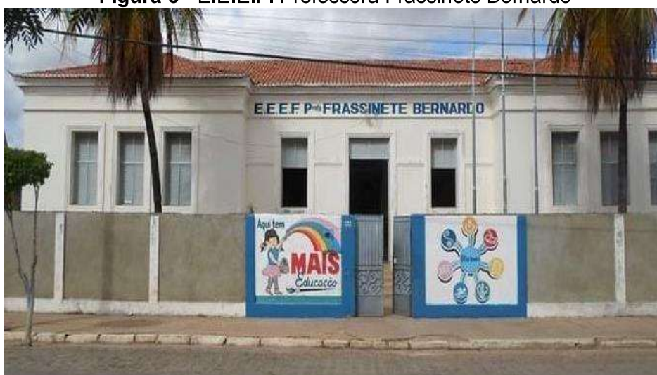
Figura 3 - E.E.E.F. Professora Frassinete Bernardo