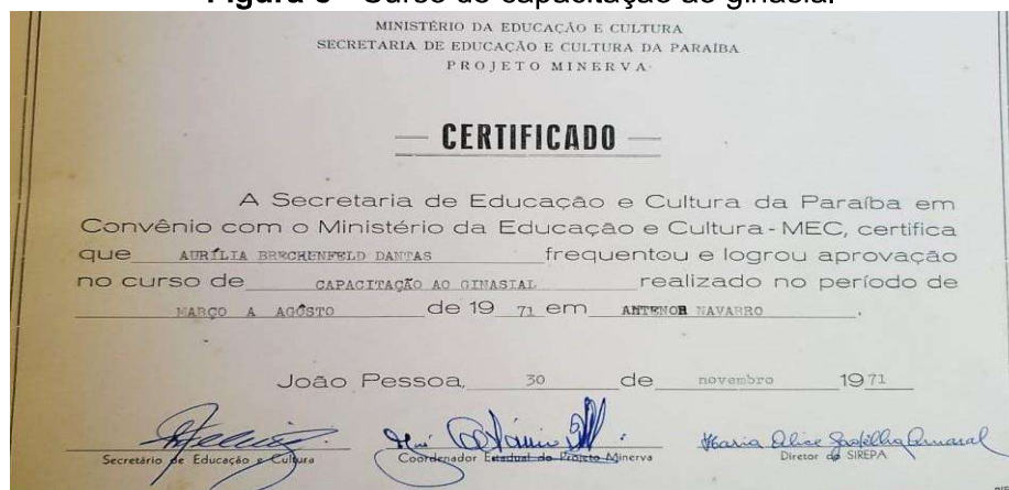
Figura 8 - Curso de capacitação ao ginasial

A seguir, temos alguns diplomas dos cursos que ela concluiu em sua trajetória de formação.