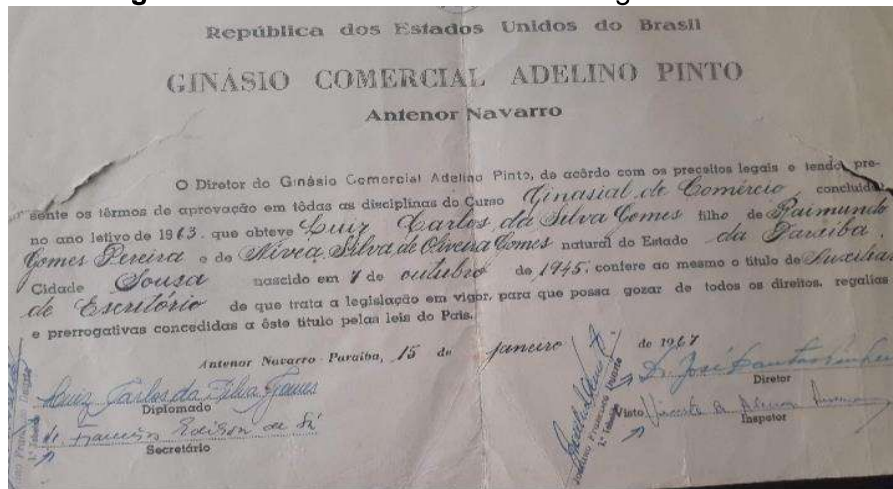
Figura 5 -Certificado do curso de datilografia de aluno