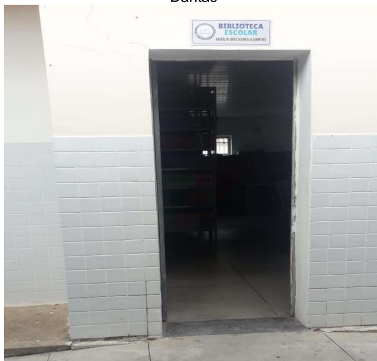
Figura 17 - Biblioteca Escolar Aurília Breckenfeld Dantas