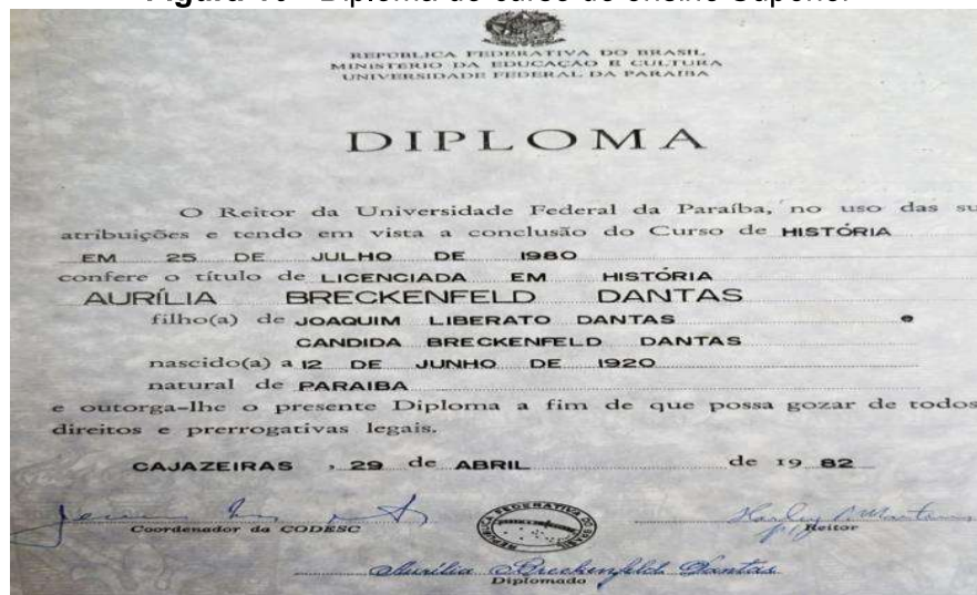
Figura 10 - Diploma do curso do ensino Superior