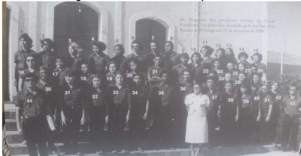
Figura 14 - Coral Estudantil São-joanense