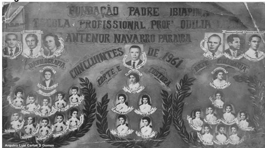
Figura 6 - Placa dos concluintes da Escola Profissional Odília Leal