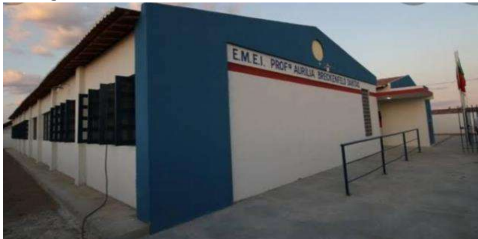
Figura 18 - E.M.E.I. Prof. a Aurília Breckenfeld Dantas

Fonte: https://www.google.com/imgres?imgurl=https://paraiba.pb.gov.br/noticias .