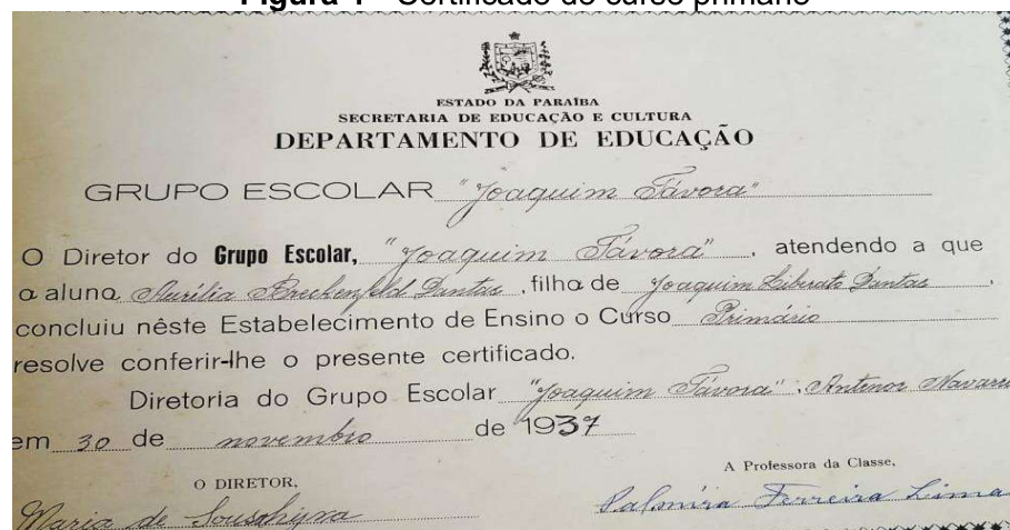
Figura 1 - Certificado do curso primário