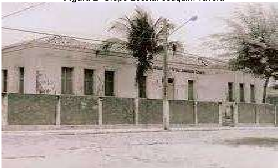
Figura 2- Grupo Escolar Joaquim Távora