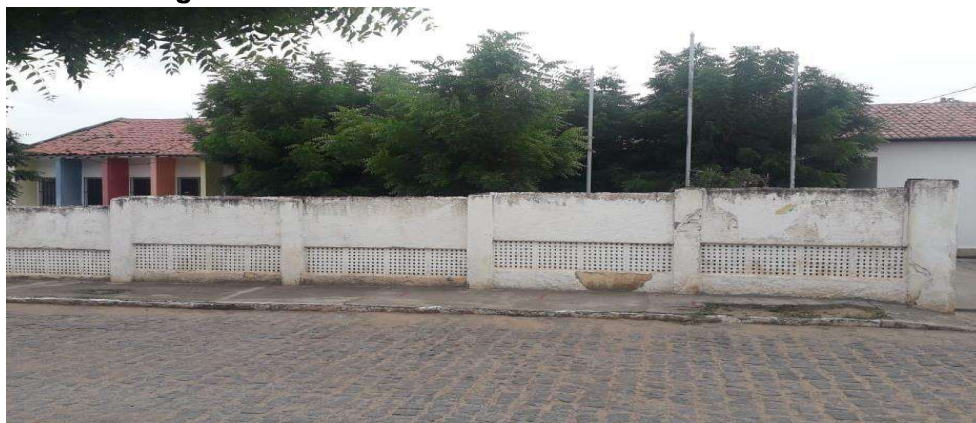
Figura 16 - E.E.E.F.M. Ministro José Américo de Almeida

Logo mais, temos as fotografias da escola e da biblioteca.