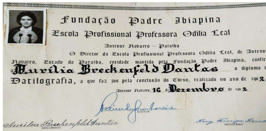
Figura 7 - Certificado do curso de datilografia

Além de ser funcionária da referida instituição, Aurília também foi aluna da escola Profissional Odília Leal, instituição que funcionava no mesmo prédio que funcionava o Ginásio Comercial Adelino Pinto. É possível confirmar através de seu certificado do curso de datilografia.