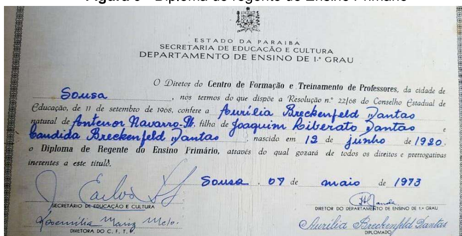
Figura 9 - Diploma de regente do Ensino Primário