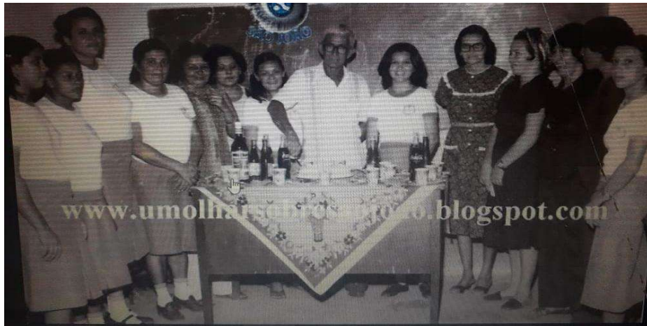
Figura 13 – Festa de aniversário no Colégio Ministro José Américo de Almeida