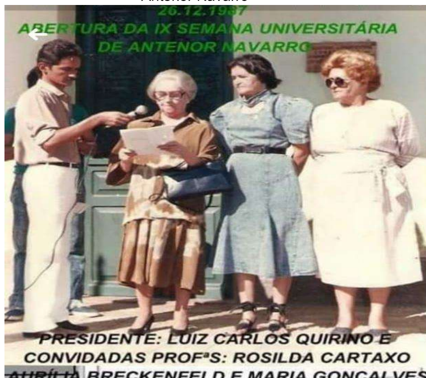
Figura 12 – Foto de participação Abertura da IX Semana Universitária de Antenor Navarro