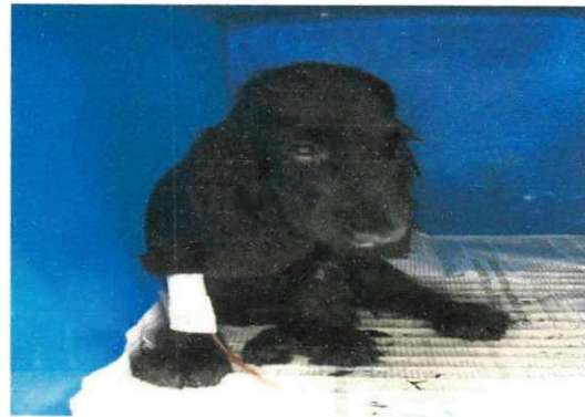
Figura 2. Animais atendidos CMPA/HV.