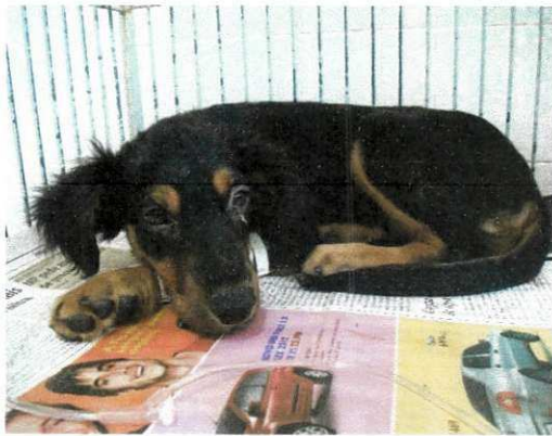
Figura 1. Animais atendidos CMPA/HV.

Foram utilizados 22 cães da rotina de atendimento ambulatorial do Hospital Veterinário (HV) e do Centro Médico Veterinário Dr. Leonardo Torres (CMVLT), sem pré-requisitos quanto à idade, sexo ou raça, apresentando sinais de distúrbios gastroentéricos, evidenciados após avaliação clínica geral e admitido como quadro gastroentérico infeccioso viral por parvovirus através do teste imunocromatográfico.