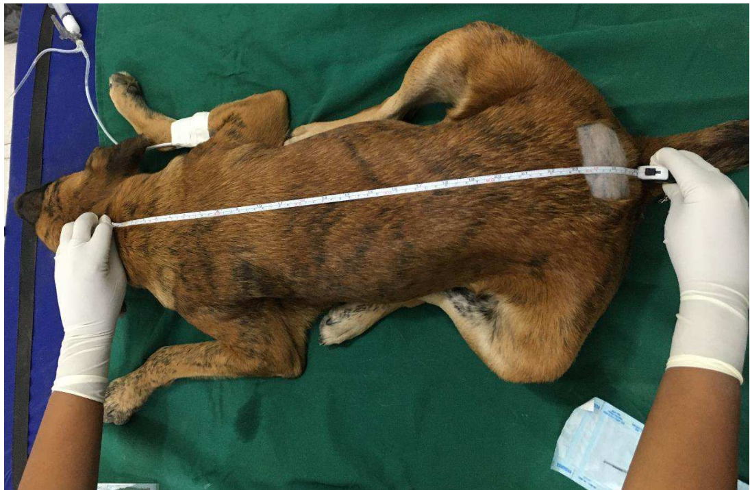
Figura 1: Mensuração da distância da articulação atlantooccipital até a base da cauda, para determinação da dose de contraste a ser administrada.

Após o estabelecimento da anestesia, o animal foi colocado em decúbito esterno-abdominal sobre a mesa de exame radiográfico, realizou-se a tricotomia na região lombossacra e mensurou-se a extensão da coluna vertebral, da articulação atlantooccipital até a base da cauda, com o auxílio de uma fita métrica (Figura 1).