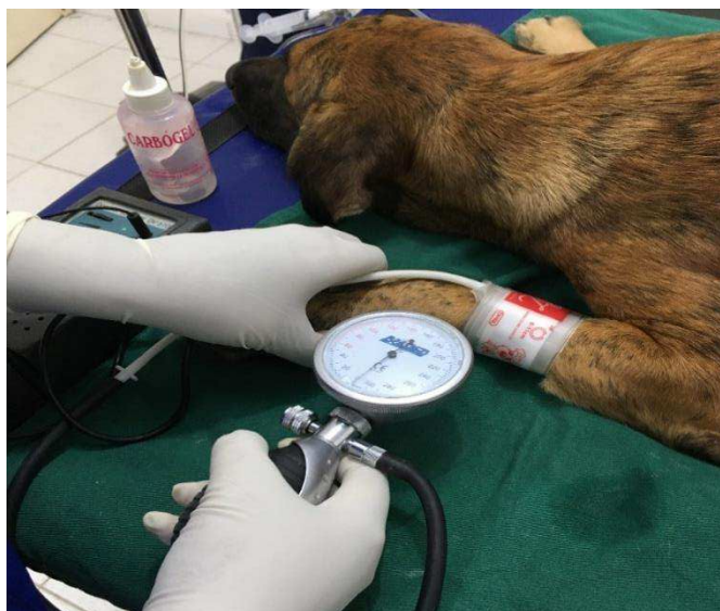
Figura 3: Posicionamento do manguito no membro do animal, para mensuração da pressão arterial sistólica.

A pressão arterial sistólica (PAS) foi analisada, em milímetros de mercúrio (mmHg), através do sistema doppler 8 , posicionando-se um manguito inflável com largura correspondente a 40% da circunferência do local de colocação do mesmo, proximal à articulação cárpica (Figura 3). Esse manguito foi inflado até que o ruído característico da pulsação arterial ficou inaudível e, em seguida, esvaziou-se lentamente até que o som da pulsação voltasse a ser ouvido. Neste momento, foi observado o valor no esfigmomanômetro acoplado ao manguito, que representava a PAS.