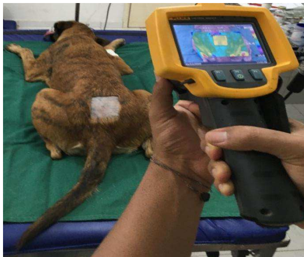
Figura 5: Mensuração da temperatura superficial.

A temperatura cutânea superficial da região lombossacra foi mensurada, em graus Celsius (°C), por termografia de infravermelho, utilizando uma câmera termográfica 2 com calibração automática e emissividade de 0,98, recomendada pelo fabricante para tecidos biológicos, nos momentos T-15, T0, T20, T40 e T60 (Figura 5). Cada termograma gerado foi gravado em um cartão de memória e posteriormente analisado pelo software Smartview versão 3.1, onde foram obtidas as temperaturas médias da região.