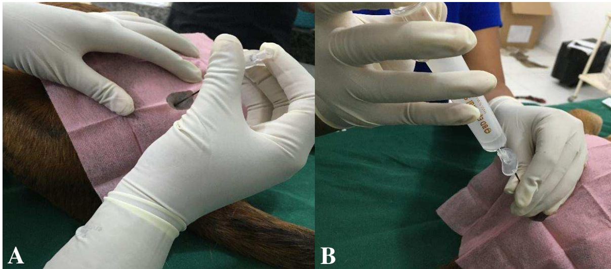
Figura 2: Administração do contraste, após a indução da anestesia e posicionamento do animal. A - introdução da agulha de Tuohy no espaço epidural lombossacro; B – administração do contraste.

foi confirmado pela aspiração do contraste previamente depositado no canhão da agulha ou pela ausência de resistência ao êmbolo da seringa. Manteve-se o bisel da agulha direcionado cranialmente durante a administração do ioversol, a qual foi realizada com duração padronizada em 90 segundos (Figura 2 B). Após a deposição do ioversol, o animal foi mantido em decúbito esternoabdominal durante cinco minutos.