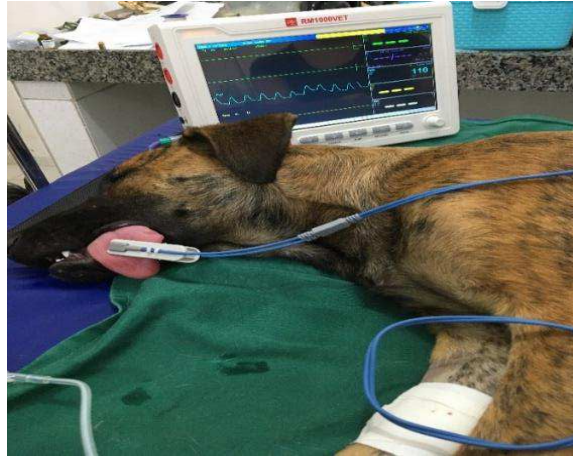
Figura 4: Posicionamento do sensor de oximetria na língua do animal, após a indução da anestesia, para mensuração da SpO 2 .

momento T40, quando os animais já estavam se recuperando da anestesia, o sensor de oximetria foi reposicionado em um dos tetos.