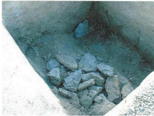
Figura mostra exemplo de rocha dura