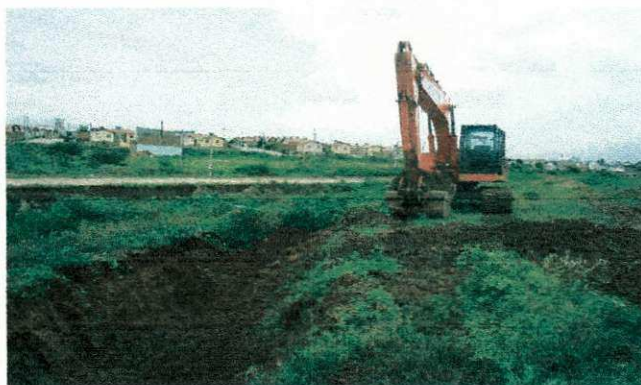
FOTO 07 - Escavação mecânica em terra até 2,0 m

Classifica-se como escavação em terra aquela passível de execução sem a necessidade de utilização do escarificador, ou seja, a escavação é feita apenas com a lâmina do equipamento (tratores, pás carregadeiras ou motoniveladoras).