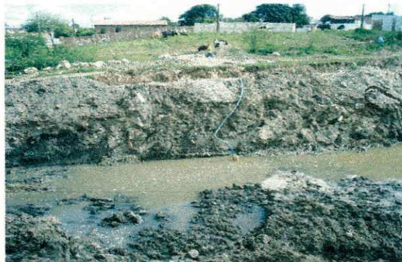
FOTO 08 - Esgotamento de vala

A empreiteira deverá dimensionar as instalações de bombeamento com suficiente margem de segurança e deverão ser previstos equipamentos de reserva, incluindo grupo moto-bomba a diesel, para eventuais interrupções de energia elétrica.