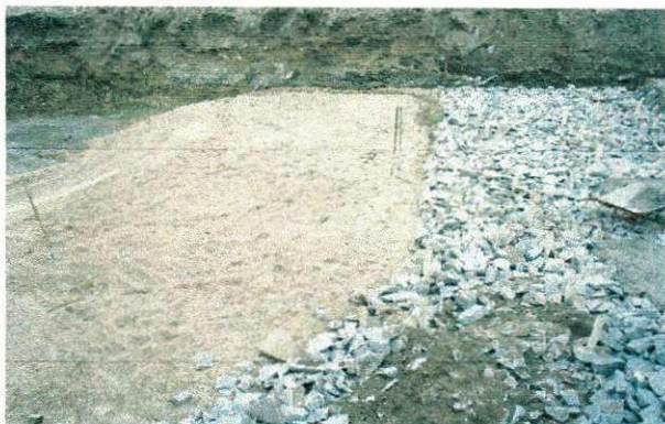
FOTO 10 - Colchão de areia no fundo do canal espessura variável - vista "A"