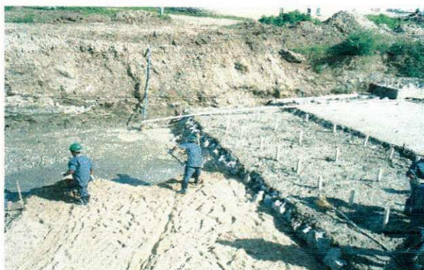
FOTO 11 - Colchão de areia no fundo do canal espessura variável - vista "B"