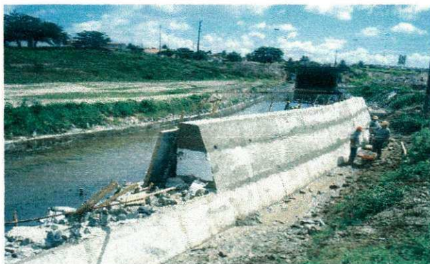
FOTO 14 - Paredes do canal em concreto ciclópico

Serão executadas as paredes do canal em concreto ciclópico, de acordo com as proporções descritas no item anterior. Estão incluídos neste item: preparo, lançamento, adensamento, regularização e cura.