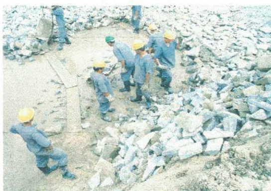
FOTO 09 - Lastro de pedra de mão

Em toda a extensão do canal será executado em seu fundo um lastro de pedra de mão em camada devidamente arrumada e com espessura mínima de 0,30m. Será admitida uma tolerância máxima de 0,50 m para cada lado, além da largura do concreto a ser aplicado no fundo do canal.