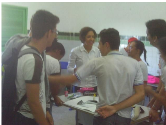
Autor: OLIVEIRA (2015)

Sobre as aulas no Ensino Médio, as regências tiveram a participação ativa dos alunos do programa Pibid, com o qual escola tinha parceria. Para mim, os colegas assim como eu também estavam em formação docente e me deram todo suporte no planejamento e realização das aulas, gerando a troca de conhecimentos mútuos. As dificuldades encontradas foram as mudanças de meus planos de acordo com a necessidade da turma e do plano de trabalho do programa Pibid, nessa dificuldade pude tirar proveito para observar minhas falhas e fazer reflexões apuradas. Tudo isso funcionou como um elemento integrador que colocou em jogo vários processos de análise crítica.