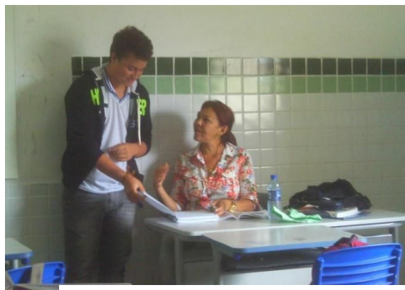
Autor: SILVA (2015).

Sobre o professor supervisor nessa etapa, me acompanhou e me deu mais segurança e confiança na elaboração dos planos de aula e execução dos mesmos. Nisso, o acompanhamento do professor em sala de aula é algo previsto pela Lei N° 11.788 de 25 de setembro de 2008, no qual o Art. 3° decreta que “o acadêmico deverá ser acompanhado e avaliado pelo professor supervisor da instituição de ensino e por um supervisor da parte concedente”, citado por Martins e Moraes (2018). Estas autoras ainda ressaltam a importância dos professores supervisores na mediação da prática pelos estagiários, bem como na troca de experiências. Assim elas, afirmam: