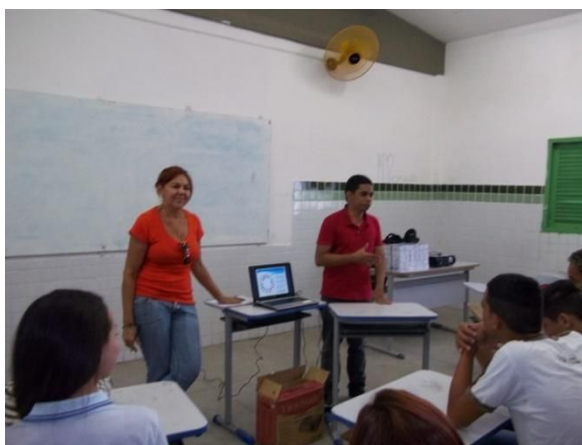
Figura 8: Estagiários iniciando a aula inaugural do projeto.

Iniciamos a execução do projeto com a aula “Porque somos diferentes?”, na qual procuramos delimitar um ambiente bem dinâmico para estagiários e alunos. Queríamos fazer a utilização de boas imagens, porém um problema no data show da escola nos impediu de projetar os slides para melhor visualização dos alunos. Entretanto, tivemos que adotar um plano B, utilizamos a visualização diretamente no notebook para nos auxiliar a apresentar as imagens aos alunos (Figura 8).