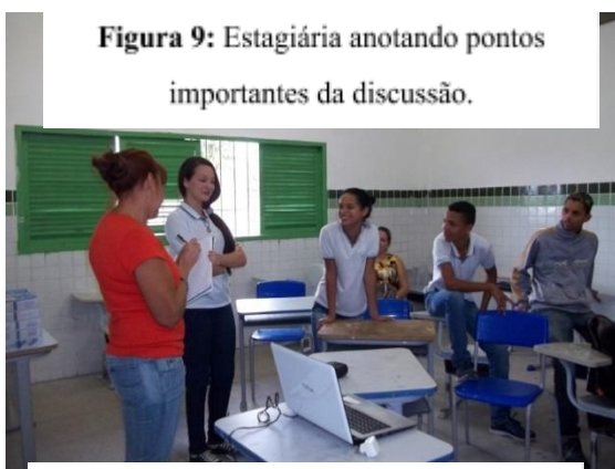
Autor: MARQUES (2016).

Nessa aula fizemos um desafio, um olhar o outro e falar sobre suas características e diferenças, foi um debate muito proveitoso (Figura 9). E em seguida lançamos mão de imagens fotográficas as quais podiam ser comparadas, japoneses, indianos, africanos, árabes, etc.