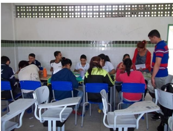
Autor: MARQUES (2016).