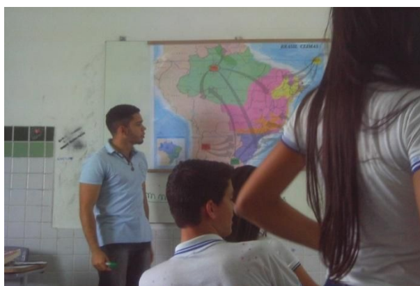
Autor: OLIVEIRA (2015)

Houve também oficinas para a confecção de cartazes, sobre a temática Urbano e o Rural, a turma foi dividida em dois grupos para cada um elaborar um cartaz de acordo com seu tema (Figura 7). Os alunos participaram ativamente dessa atividade, na qual foram discutidos pontos negativos e positivos sobre a cidade e o campo.