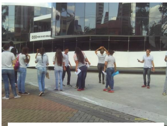
Autor: OLIVEIRA (2014).