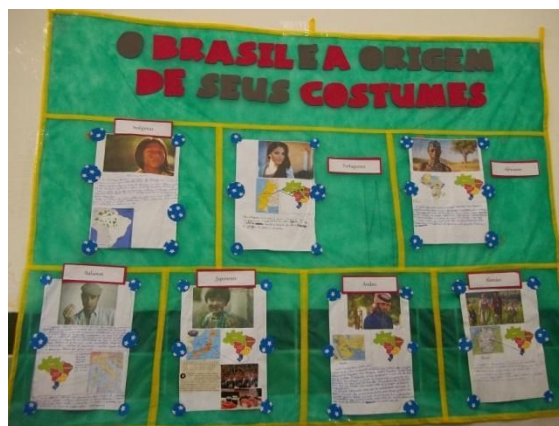
Autor: MARQUES (2016)