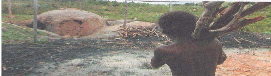
Figura 1: Infância roubada