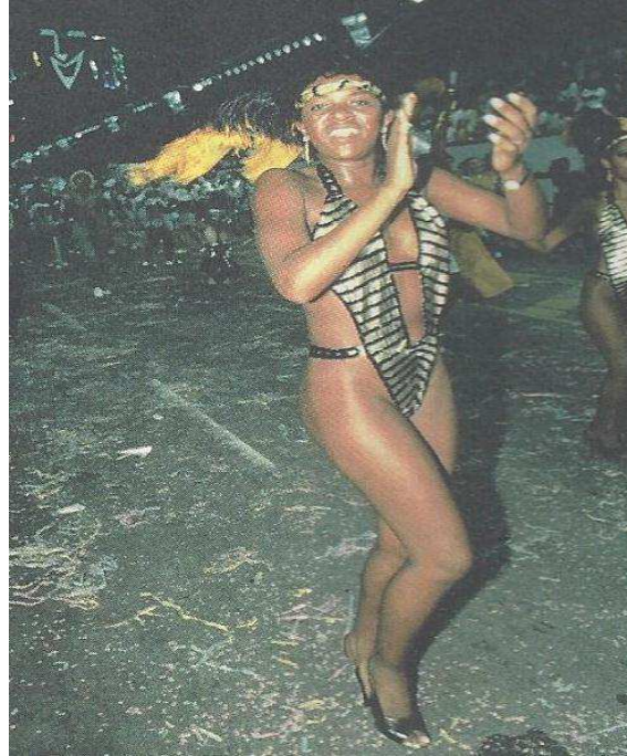
Figura 7: A imagem da mulher negra