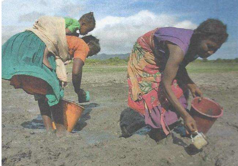
Figura 2: Tudo resumido a isso?