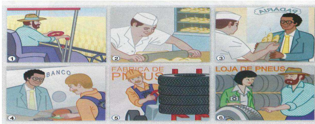
Figura 3: Outro olhar para o negro

FONTE: Geografia: espaço e vivência 5ª série ,2005, p. 153