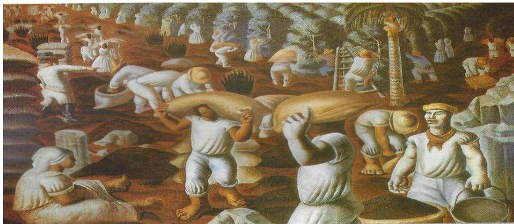
Figura 4: Negros iguais