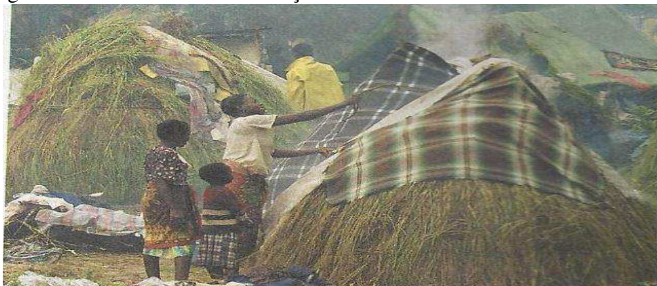
Figura 8: Uma infância de construção.