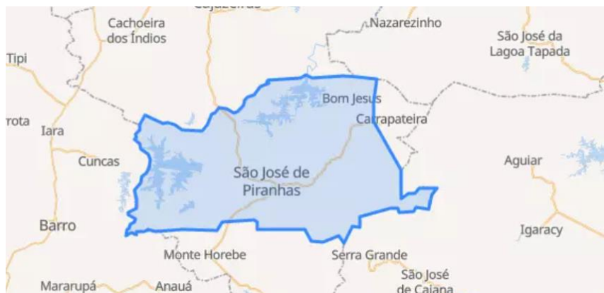
Figura 1 – Mapa do município de São José de Piranhas.

O município de São José de Piranhas localiza-se no Estado da Paraíba, precisamente na região do Alto Sertão paraibano, com uma população estimada em 20.406 habitantes, segundo (IBGE, 2021).