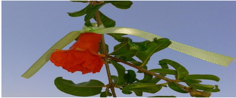
Figura 2: Marcação das flores, Sousa-PB, 2014.

Após os frutos atingirem as idades preestabelecidas realizou-se a colheita dos mesmos no período da manhã. Foram realizadas 5 coletas em distintas épocas num intervalo de dez dias. Assim foram colhidos e analisados frutos aos 60, 70, 80, 90 e 100 após a antese (Figura 3).