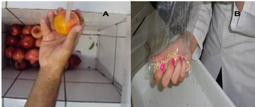
Figura 4: Lavagem dos frutos (A), extração do suco (B).

sanitizados com solução de hipoclorito de sódio a 100ppm de cloro livre por quinze minutos e secos a temperatura ambiente (Figura 4.A). Os arilos foram separados da semente por prensagem manualmente em saco plástico de polietileno (Figura 4.B). Posteriormente, o volume de suco extraído dos arilos foi utilizado para as análises. Para as análises de antioxidantes, o suco foi mantido em recipiente fechado envolto com papel alumínio, sendo mantidos congelados em freezer até a realização das análises.