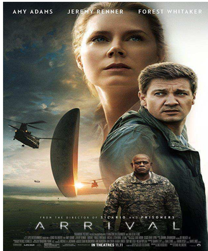
Figura 1 - Capa oficial do filme Arrival