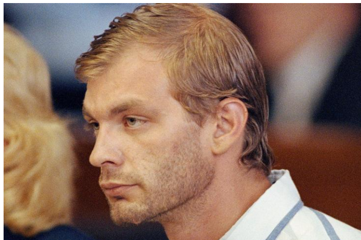
Fotografia 2 – Jeffrey Dahmer durante um de seus julgamentos