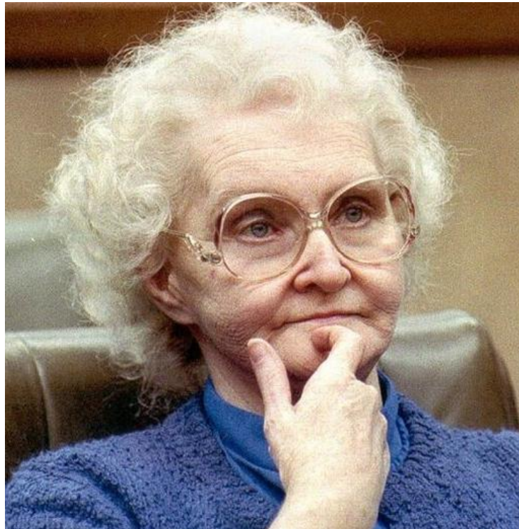
Fotografia 3 – Dorothea Puente durante um de seus julgamentos