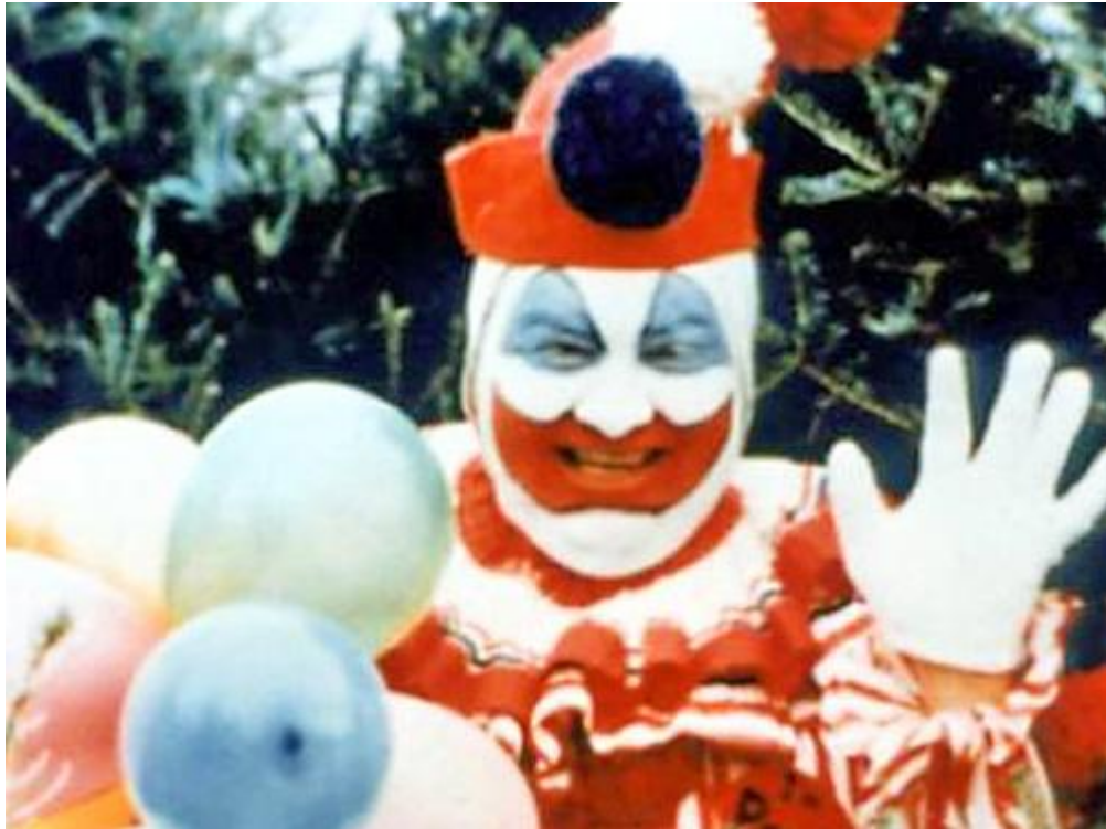
Fotografia 4 – John Wayne Gacy Jr. vestido de seu alter ego, palhaço Pogo