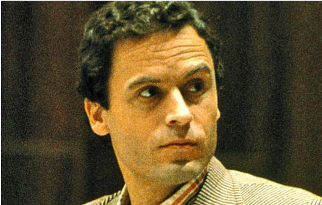
Fotografia 1 – Ted Bundy durante seu julgamento