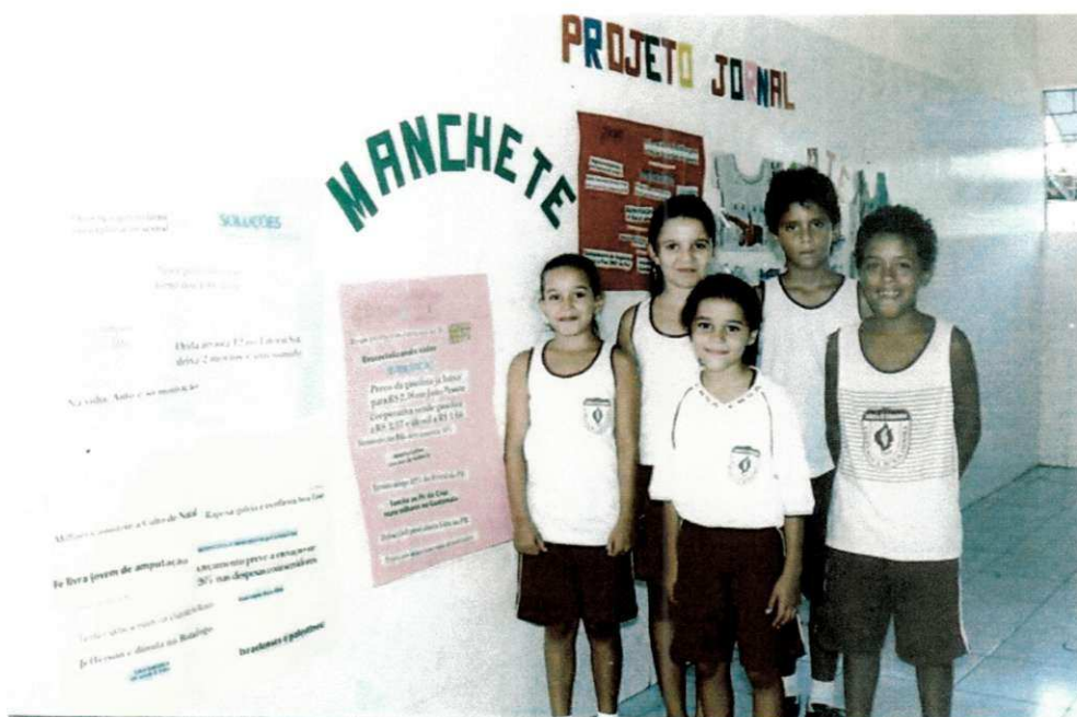
3.8 Culminância do projeto com jornal apresentada pelas crianças da 3ª Série. Março/2007.