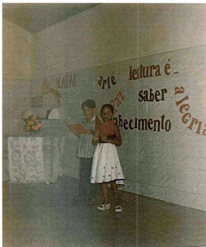
3.2 Casal apresentador do Projeto Lendo e Criando a partir de portadores sociais de texto. Nov/2005.