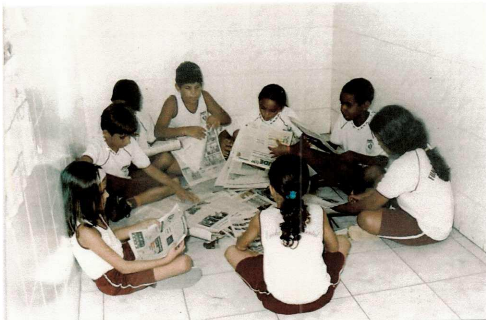
3.4 Alunos da 3ª Série da Escola Experimental planejando Projeto com Jornal. Mar/2007.