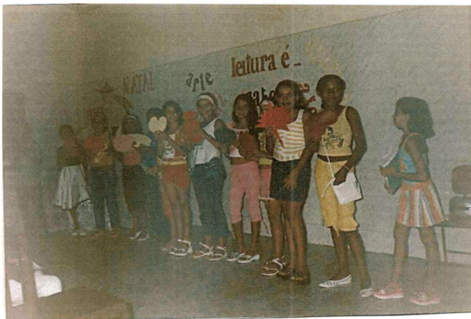
3.1 Alunos da Escola Experimental do C. N. S. Auxiliadora apresentando o Projeto Lendo e Criando a partir de portadores sociais de texto. Nov/2005.