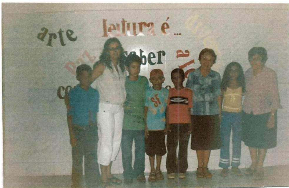
3.3 Presença das diretoras e supervisoras da Escola Experimental na culminância do Projeto Lendo e Criando a partir de portadores sociais do texto. Nov/2005.