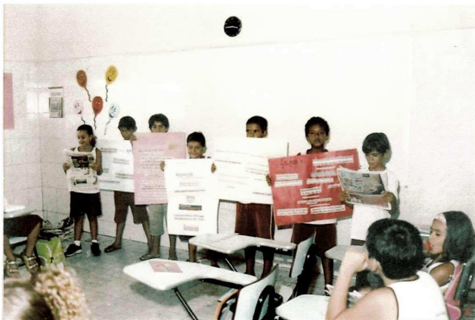
3.7 Os grupos da 3ª Série apresentam os cartazes. Março/2007.