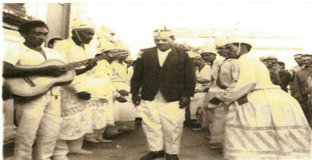
(Acervo Verneck Abrantes, Grupo Congos, 1962, em apresentação pública)

A modernidade interfere, essa nova geração tem recebido uma carga através da televisão, do rádio, através da falta de entendimento, que interfere é tanta que a gente ver que nossos familiares ele se intimidam, eles não tem aquela coragem que nós tivemos, porque vamos supor, eu tenho 42 anos e entrei com oito anos, então que dizer a mentalidade de uma pessoa de três décadas atrás é diferente de uma pessoa dessa nova geração. Muitos deles se sentem envergonhado porque percebem na sociedade certo preconceito, uma discriminação porque cultura negra, e para muitos cultura negra é uma coisa feia. Essa nova geração mesmo tendo sangue negro eles ficam intimidados, a gente percebe que é difícil eles aceitarem que estarão andando de saia ou com lança. Essa nova cultura imposta pela televisão, pelo próprio rádio, não querer esta ouvindo os cantos dos Congos, dos Pontões, da banda cabaçal, do que se canta a Irmandade do Rosário. E claro que temos que ser realistas existe uma concorrência hoje desleal, nas outras a investimentos, a indústria que investe nessa nova cultura. E qual a indústria que investe na cultura de raiz local, a gente nem tem coragem de falar, mas sabemos dessa deslealdade da concorrência. (MIGUEL,2012)