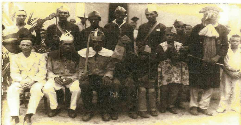
(Acervo Verneck Abrantes, Grupo Congos, 1964, reunidos juntamente com seus descendentes)

A partir desse pressuposto das colocações do IPHAN, relacionamos a teoria e a prática, ao avaliarmos as falas dos entrevistados, notamos as características da preservação, da memória dos seus antepassados, como construção coletiva desse patrimônio cultural para a cidade Pombal-PB, moldando e forjando identidades. Participar dos grupos seria dar continuidade a uma herança familiar, tradição, fé, amor a Nossa Senhora do Rosário, envolvendo um emaranhado de sentimentos, que revelam a pertença de um grupo que através das dificuldades econômicas, sociais se mantiveram firmes diante da necessidade de dar continuidade a um legado.