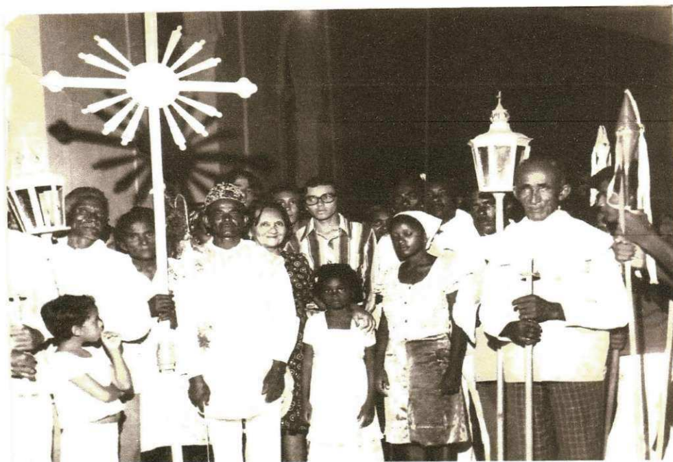
(Acervo Verneck Abrantes, Festa do Rosário 1978, Parte da Irmandade do Rosário).

As irmandades são instituições religiosas que, para poderem funcionar precisavam da autorização do Estado e da Igreja. Seus integrantes apresentavam na Assembleia Legislativa Provincial um documento, denominado de Ordem de Compromisso, onde descreviam o estatuto e as intenções de sua confraria. Entretanto, discute-se que esses documentos tinham aspectos peculiares que variavam de acordo com a Irmandade de cada localidade, ressaltando que esses evidentemente tinham a intenção de aprovação do Estado.