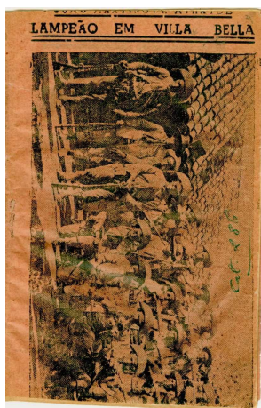
Capa ilustrada com a imagem do grupo de Lampião.

O folheto intitulado Lampião em Villa Bela (hoje Serra Talhada-PE) escrito por João Martins de Athayde em setembro de 1946 apresenta na capa o grupo de Lampião: