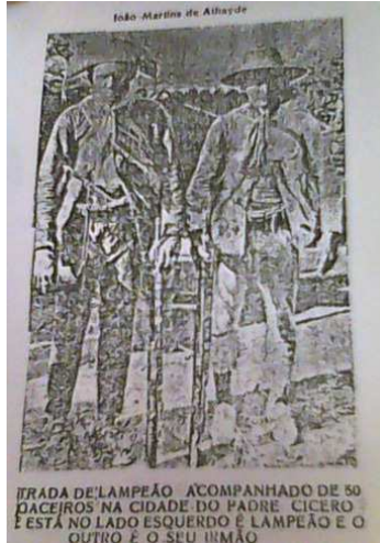
Capa ilustrada com a imagem de Lampião e seu irmão.