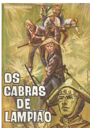
Capa ilustrativa com a imagem de Lampião.