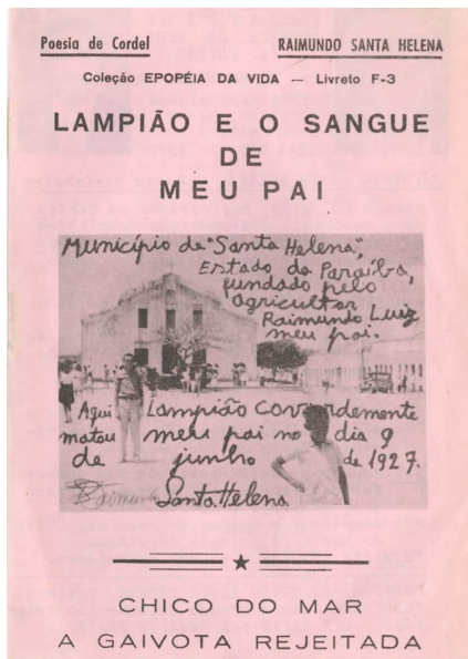
Capa ilustrada com algumas informações sobre o folheto