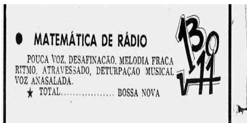
Figura 06: Matemática do Rádio (Revista do Rádio – 1960)