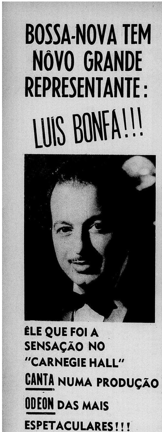
Figura 09: Bonfá – Revista do Rádio