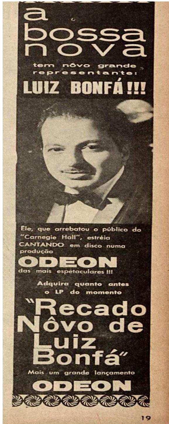
Figura 10: Bonfá – Radiolândia