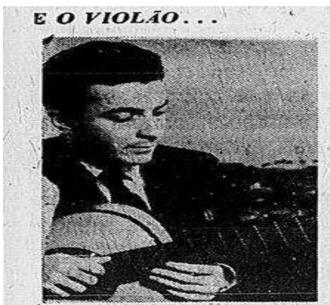
Figura 07: João Gilberto