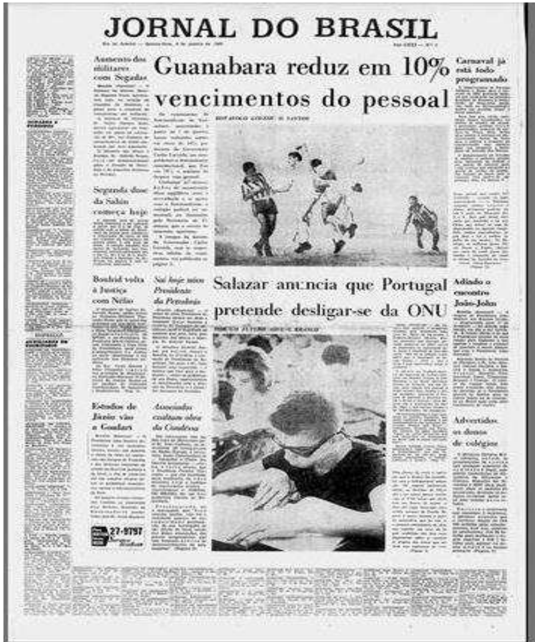
Figura 02: Capa 04 jan. 1962 4

Destacamos que não apenas o Jornal do Brasil passa por reformulações com intuito de “modernizar-se”, foi um processo que outros impressos também passaram, mais cedo ou mais tarde, devido, principalmente, ao desenvolvimento e interesse do público por outras mídias de informação e entretenimento. Mesmo com o rádio e a televisão ganhando proporções de