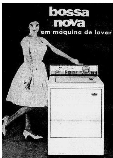
Figura 03: Publicidade Jornal do Brasil 03 abr. 1960

Brastemp que, a partir de março de 1960, passou a ser conhecida por “lavadora bossa nova”. A “princesinha do lar” rapidamente aderiu ao slogan sensação da classe média carioca. De máquina de lavar à profissão, tudo virou bossa nova: advogado bossa nova, engenheiro bossa nova, pintor bossa nova e, até mesmo, o presidente virou bossa nova.