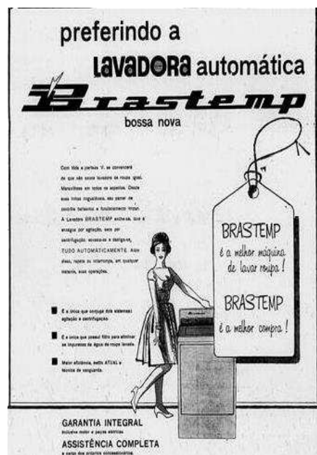
Figura 04: Publicidade Correio da Manhã 08 Mai. 1960

O presidente símbolo da euforia e “modernidade” experimentadas pela classe média brasileira a partir de 1955, rapidamente e não menos surpreendente, passaria a ganhar a alcunha sensação a partir de 1959. Bossa nova de máquina de lavar passou também a fazer parte enquanto nomenclatura do cargo político mais importante do país. Não apenas passaram a chamar o então presidente Juscelino Kubitschek de “Presidente Bossa Nova”, como o próprio representante máximo da nação aderiu de bom grado seu novo codinome. Começou-se então a associar as a política de Juscelino com a ideia de inovação e, por assim dizer, bossa nova. Disso, tudo o mais que o presidente fazia era considerado bossa nova em termos políticos e diplomáticos. Caracterizações tais quais ser bom “pé de valsa”, cavalheiro, empreendedor e ações políticas como acordos políticos com os Estados Unidos configuravam a política “moderna” e bossa nova em torno da figura de Juscelino.