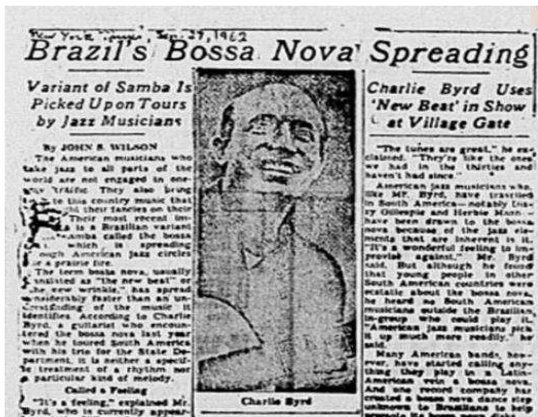
Figura 08: Charlie Byrd e a bossa nova

Portanto, já antes do evento do dia 21 de novembro, houve uma crescente divulgação do trabalho dos norte-americanos os quais estiveram relacionados com a bossa nova. Ao lado da reimpressão da matéria do New York Times enfatizou o Jornal do Brasil o seguinte: